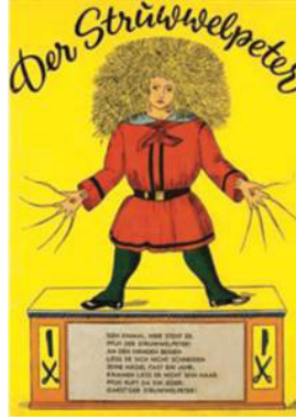
Resim 2: Hoffman, Struwellpeter Kitabından İllüstrasyon

Kitabın içerisinde inisiyal harflerin ve illüstrasyonların kullanımından oluşmaktadır. Resimli çocuk kitabı tarihinde önemli bir rol oynayan bir diğer kitap ise Heinrich Hoffman'ın Struwellpeter adlı çocuk kitabıdır. Karışık tekniğin kullandığı kitapta yaramazlık yapan karakterlerin başlarına gelen trajik olaylar konu edinmektedir. Kitapta çorbasını içmeyi reddeden bir çocuk incelerek ölürken, parmağını sürekli emen bir çocuğun berber tarafından eli kesilmesi gibi resimlemeler barındıran kitapta çocuklar için oldukça ürkütücü hikayeler olduğu görülmektedir.