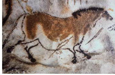
Resim 1: Bir at resmi, Lascaux Mağarası

İnsanlığın iletişim kurmasının yazının bulunmasından çok önce mağara duvarlarına resimler yapılmasıyla başladığını söylemek mümkündür. Resimli çocuk kitaplarının tarihi illüstrasyonun ilk kez kullanıldığı mağara resimlerine kadar gittiği ifade edilebilmektedir. Avrupa mağara sanatının en iyi örneklerinin Buzul çağının son döneminde M.Ö. 15.000-10.000 yılları arasında Fransa'nın güneybatısı ve İspanya'nın kuzeyinde tasvir edilmektedir (Graham-Dixon, 2010, s.38). Mağara resimlerine bizon, sığır, at, aslan gibi hayvanların tasvir edildiği görülmektedir. Bu resimlerin hangi amaçla yapıldığı kesin olarak bilinmemekle birlikte ritüel, büyü, avda şans getirmesi gibi nedenler sebebiyle yapıldığı düşünülmektedir.