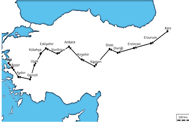
Şekil 1. Timur'un 3. Anadolu Seferi güzergâhı