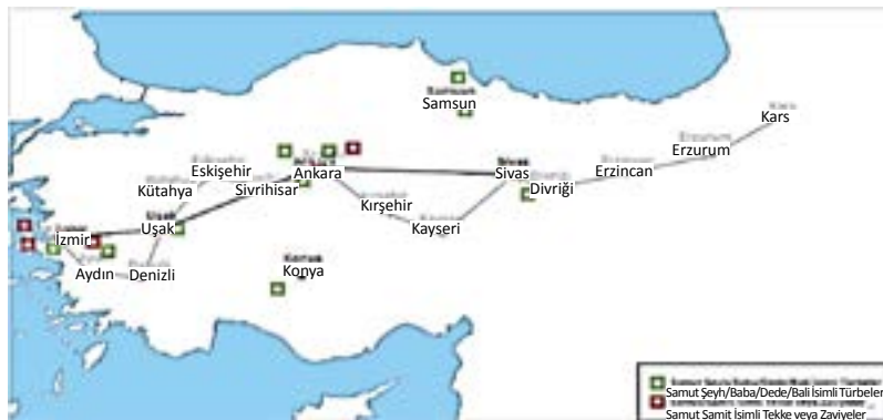
Şekil 3. Timur'un 3. Anadolu Seferi güzergâhı ile Samut Baba isimli türbe, tekke veya zâviyelerin karşılaştırması