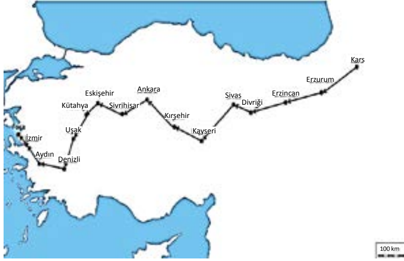
Şekil 1. Timur'un 3. Anadolu Seferi güzergâhı