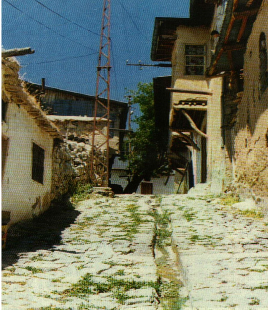
Resim 1: Çıkmalı evleriyle bir Sokak Abdullah (Özbek, Bütün Yönleriyle Çemişgezek , s. 51).