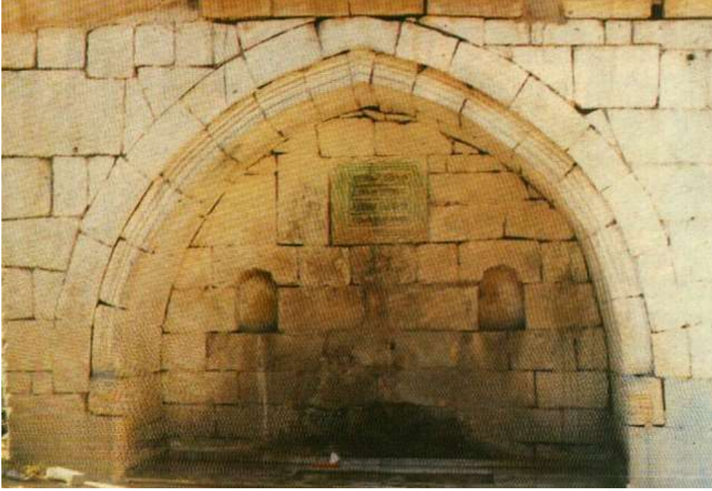
Resim 6: Baş Çeşme (Özbek, Bütün Yönleriyle Çemişgezek , s. 90).