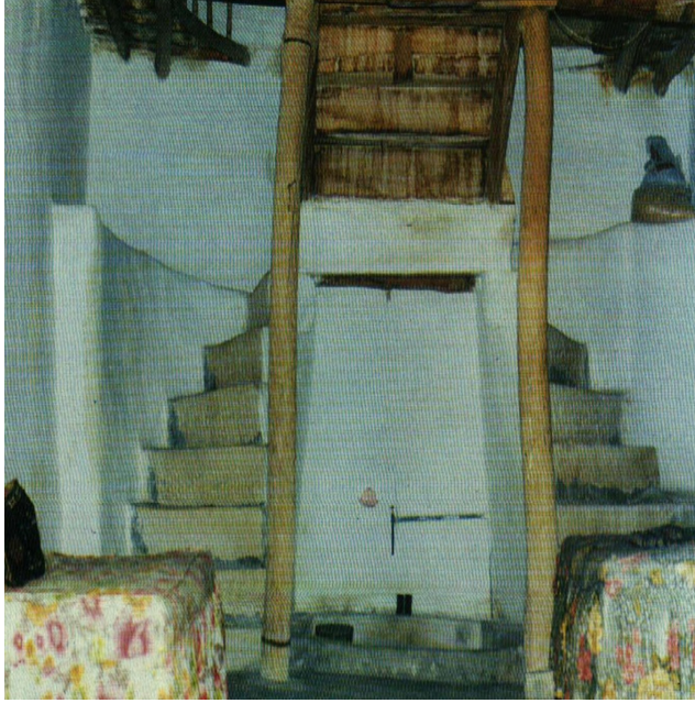
Resim 3: Bir evin alt katı (Özbek, Bütün Yönleriyle Çemişgezek , s. 135).