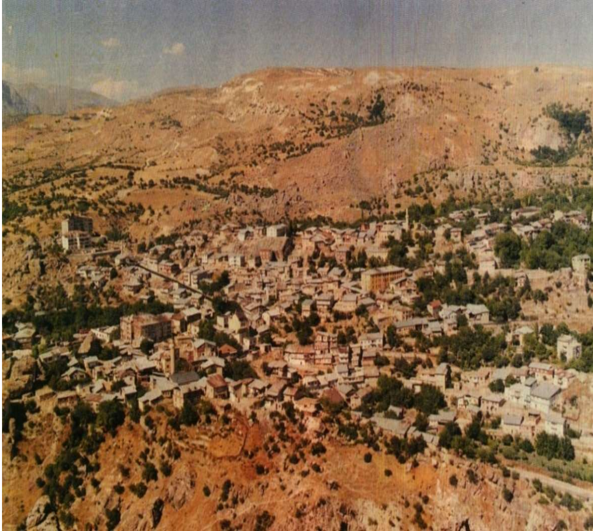
Resim 1: Çemişgezek Şehrinin Genel Bir Görünümü (Abdullah Özbek, Bütün Yönleriyle Çemişgezek , s. 14).

16. yüzyıl tahrir kayıtlarında şehir olarak geçen yerleşim yerinde bir Ulu Camii ve medresenin yanında kasaphane, meyhane, boyahane gibi hem sanayi hem de ticari tesislerin olması bu yüzyılda Çemişgezek şehrinin küçük ölçekli bir yerleşim merkez olduğunu göstermektedir. Küçük ölçekli bir şehir niteliği taşıdığı için dini ve eğitim müesseselerin sayısı da azdı. Zira Ulu Camii ve medresenin haricinde şehirde Molla Halil, Veli Bey ve Hayme Hatun isminde üç mescit vardı 19 . Dolayısıyla bu yüzyılda şehir merkezinde sakin olan Müslüman nüfusun miktarı fazla değildi. Nitekim tahrir defterlerinde şehir merkezinde vergi vermekle yükümlü olan Müslümanlara ait hane