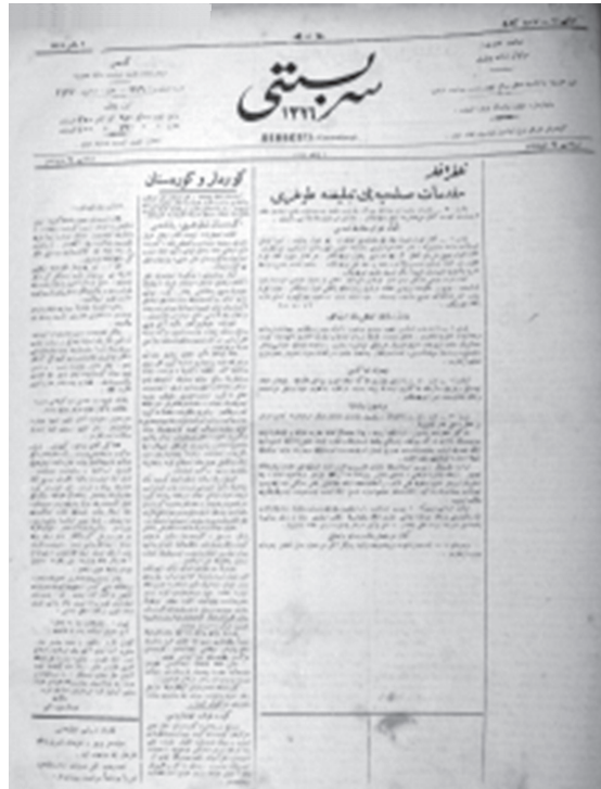
Serbestî , h. 483, 2 Mayıs 1919

Ji van agahdariyan diyar dibe ku Serbestî , di vî dewreyê de wek weşaneke rojane ya KPKê hatiye neşîrkirin.