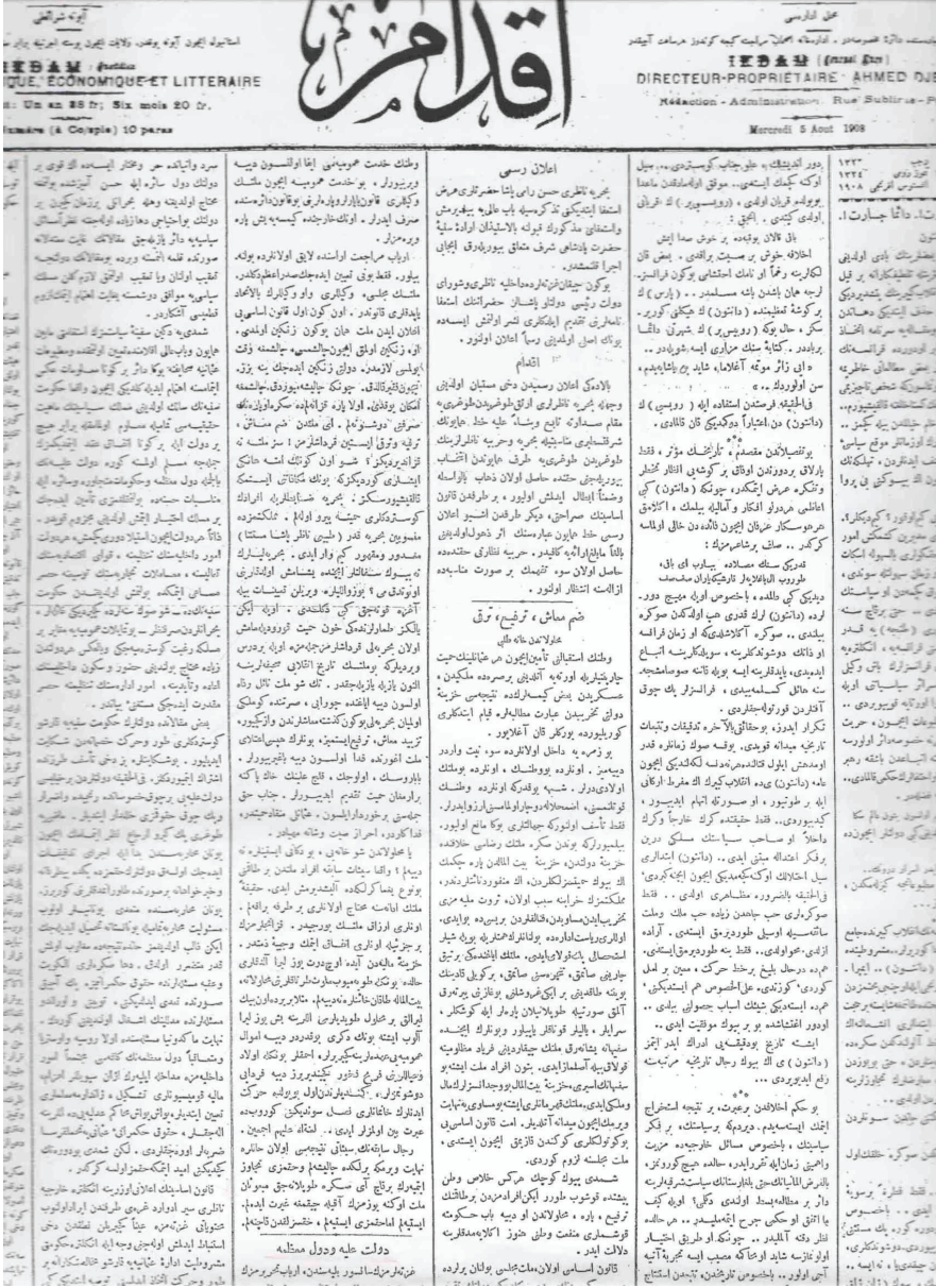
EK 12: 5 Ağustos 1908 tarihli İkdâm gazetesinin ilk sayfasında 'Devlet-i Aaliyye ve Düvel-i Muazzama' başlıklı yazı.