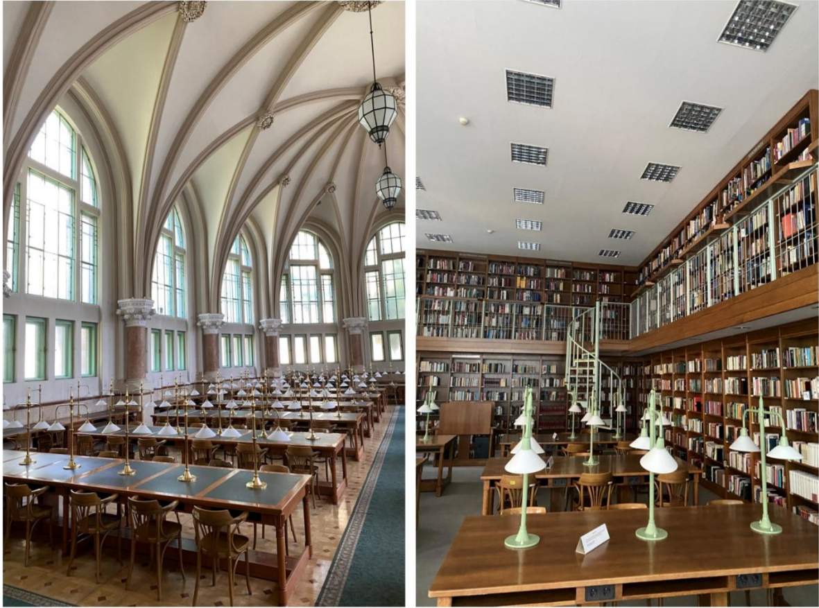
Şekil 5. Kütüphane salonlarına ait görseller.

Zengin ve gelişmiş kütüphane hizmetleri sunması, ilk yurtdışı deneyimi olması ve kültürleri Türkiye'ye daha yakın olması sebebiyle ilk tercih Macaristan olarak seçilmiştir. Bu doğrultuda Budapeşte Teknoloji ve Ekonomi Üniversitesi'ne bir e-posta yolu ile Erasmus+ programı kapsamında üniversitelerini ve kütüphanelerini ziyaret etme talebi yönlendirilmiştir. İki tarafında uygun olduğu bir tarih aralığı bulduktan sonra karşı kurumdan bir davet mektubu talep edilmiştir. Davet mektubu içeriğinde dijital becerilerin geliştirilmesine yönelik faaliyetler yapılacağı belirtilmesi seçim kriterlerinde puan kazandırdığından dolayı bu ifade mektuba eklenmiştir. Başvuru için önemli olacak diğer yabancı dil seviyesi ve hizmet dökümü belgeleri sisteme yüklenerek başvuru işlemi gerçekleştirilmiştir. Tüm başvurular TED Üniversitesi Uluslararası Programlar Komisyonu tarafından değerlendirilmiş ve sonuçlar açıklanmıştır. Sonuçlarda en yüksek puan ile ilk sırada hibeli olarak kabul alınmıştır. Kabul alındığına dair karşı kuruma bilgi verilmiş ve eğitim programı talep edilmiştir.