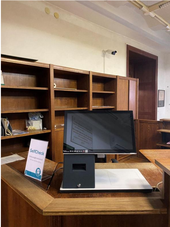
Şekil 3. Kullanıcıların kitaplarını kendilerinin alabildiği cihaza ait bir görsel.

Depolama Grubu ve Ödünç Verme Grubu olarak iki alt gruba sahiptir. Depolama Grubu, kitapların depolama odasında doğru şekilde muhafaza edilmesini sağlar ve kullanıcıların odada bulunan kitaplardan talep ettiğini karşılamakta görev alır. Ödünç Verme Grubu ise kullanıcıların talep ettiği kaynakları sağlamakta rol oynar. Bunun yanında kütüphanede yapılması planlanan etkinlik ve organizasyonlarda da görev alır. Açık Erişim kapsamında kurumsal sözleşmeler yapılmasından sorumludur.