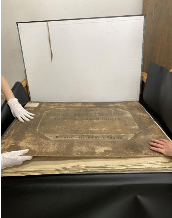
Şekil 2. Kütüphanede yer alan en büyük kitaba ait bir görsel.

Kütüphane ile ilgili yönetsel süreçlerin uygulandığı birimdir. Personelin performans değerlendirme sistemini sürdürmek, sözleşmeler hazırlamak, istatistiksel verileri raporlamak ve bütçe planlaması yapmak temel iş süreçleri arasındadır. Yönetimin birimine bağlı alt gruplar ise Bilgi Teknolojileri Grubu ve Kitap Ciltleme Grubudur. Bilgi Teknolojileri Grubu, kütüphanenin bilgi teknolojileri ve internet erişimi konularında hizmet vermekle birlikte bu hizmetlerin sürekliliğini ve gelişmesini sağlamaktadır. Kitap Ciltleme Grubu ise kütüphanenin ve arşivlerin dokümanlarını onarmak ve belgeleri dijitalleştirme süreçlerine uygun hale getirmek gibi iş tanımlarına sahiptir.