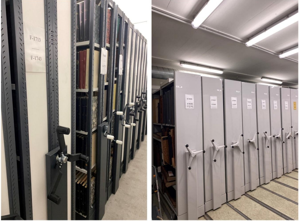
Şekil 4. Üniversite arşivlerine ait görseller.

Şekil 4’te üniversitenin farklı arşiv odalarına ait görseller yer almaktadır. Arşivler, kütüphane binasında giriş katının altında yer almaktadır. Havalandırma sayesinde serin ve kuru bir ortam sağlanmıştır. Bununla birlikte arşiv odaları kilitli şekilde muhafaza edilmektedir ve sadece görevli personeller giriş yapabilmektedir.