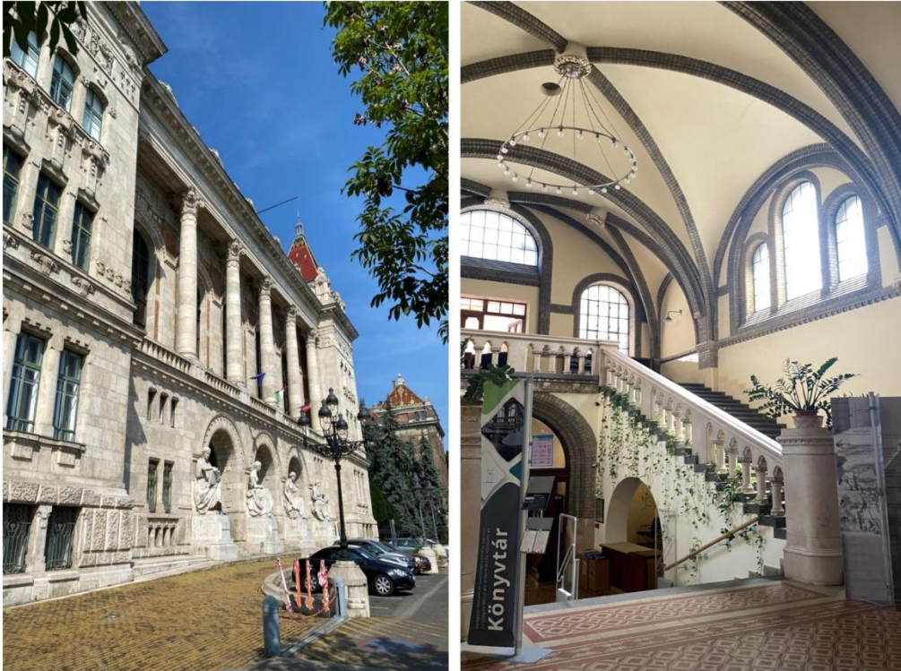
Şekil 1. Kütüphane binasına ve girişine ait görseller.

Budapeşte Teknoloji ve Ekonomi Üniversitesi Ulusal Teknik Bilgi Merkezi ve Kütüphanesi (BME OMIKK) ise zengin koleksiyonları ve hizmetleri ile Üniversitedeki araştırmayı ve eğitimi desteklemektedir. Kütüphanenin ana kullanıcı kitlesini öğretim üyeleri, öğrenciler ve idari personelleri oluştururken kamuya açık özelliği ile de dışarıdaki kullanıcılara da hizmet vermektedir (Budapest University of Technology and Economics National Technical Information Centre and Library, 2023). Kütüphanenin binasına ve girişine yönelik görseller Şekil 1’de verilmektedir.