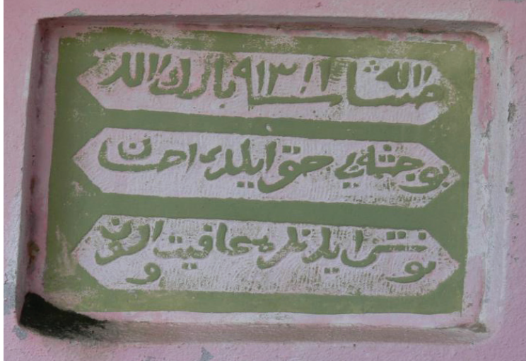
Çapak Koca Çeşme kuzey tarafı