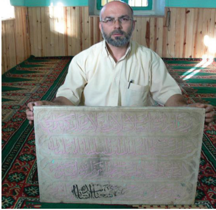
Hamidiye (Özbey) Camii çeşmesi kitabesi

Özbey (Hamidiye) Köyü Cami Çeşmesi: Çeşme bugün ayakta değildir. Çok güzel bir işçilik sergilendiği görünmektedir. Kitabe şöyledir: 1/ Ziyet Efzay-ı Makam-ı Mualla-yı Hilafet-i İslamiye ve Erike-i Pira-yı 2/ Saltanat-ı Seniyye-i Osmaniye Es-Sultan İbn'üs- Sultan Es-Sultan 3/ El-Gazi Abdülhamid Han-ı Sani Hazretleri taraf-ı Eşreflerinden İş bu çeşme 4/ Bin Üç Yüz Onbir Sene-i Hicriyesi Şabanında İnşa Edilmiştir 12 . Kitabe boyutu: 45 X 73 cm.