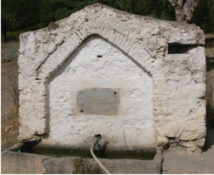
İncircik Çeşmesi

Çapak İncircik Çeşmesi: Çeşme Kuşcuburun Mahallesi'nden Çapak Mahallesi'ne çıkan ara yol üzerindedir. İki satırlık kitabesi vardır. 1-Sahib'ül-hayrat ve'l- hasenat 2- Kelkaraoğlu Bekir hayra'tı. Sene: 1311 4 . Kitabe boyutu: 64 X 37 cm.