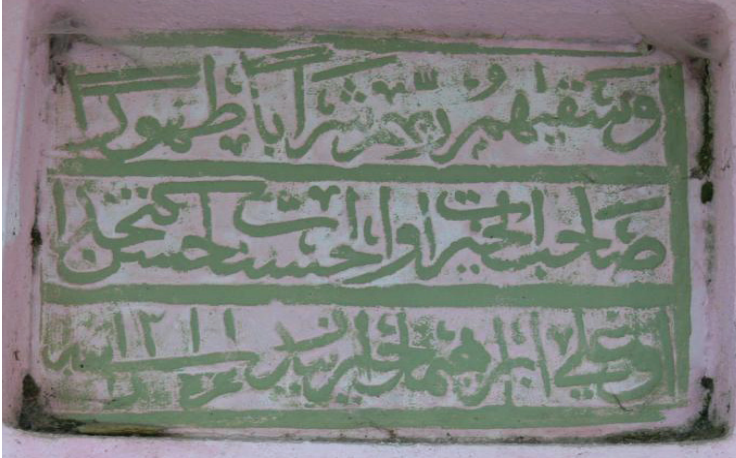
Çapak Koca Çeşme doğu tarafı kitabe2