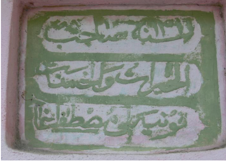
Çapak Koca Çeşme doğu tarafı kitabe1