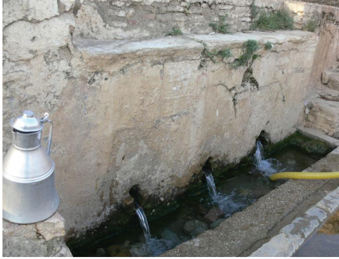
Üçoluk çeşmesi

Yazıbaşı Beldesi (Hortuna) Cami Çeşmesi Kitabesi: Kitabenin tamamı okunamamıştır. Okunabilen kısmı şöyledir: Zadeoğlu Taşlı-zade Ahmet oğlu banisi. Sene: binyüzaltmışdört 17 . Kitabe boyutu: 52 X 42 cm.