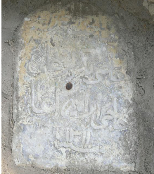
Çapak Derinkuyu Çeşmesi kitabesi