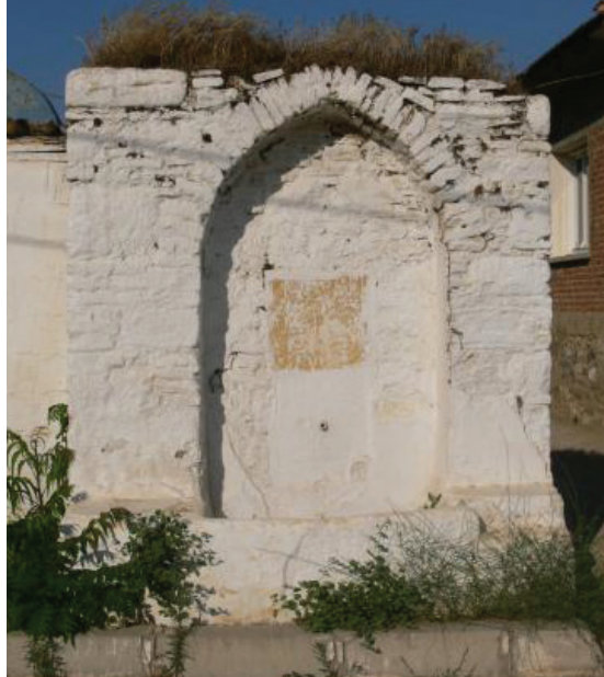
Cami çeşmesi

Yazıbaşı Beldesi (Hortuna) Cami Çeşmesi Kitabesi: Kitabenin tamamı okunamamıştır. Okunabilen kısmı şöyledir: Zadeoğlu Taşlı-zade Ahmet oğlu banisi. Sene: binyüzaltmışdört 17 . Kitabe boyutu: 52 X 42 cm.