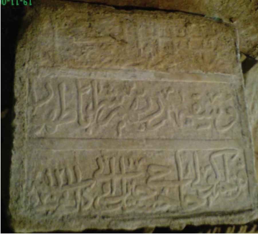
Helvacı Köy çeşmesi kitabesi

Demirciköy Kuru Çeşme: Köye yaklaşık 2 km. lik bir mesafededir. 1/Sahib ül- hayrat vel- hasenat 2/ Merhum Hacı Abdülfettah 22 3/ Hayratıdır. 4/ 1927. Kitabe boyutu: 30 X 40 cm.