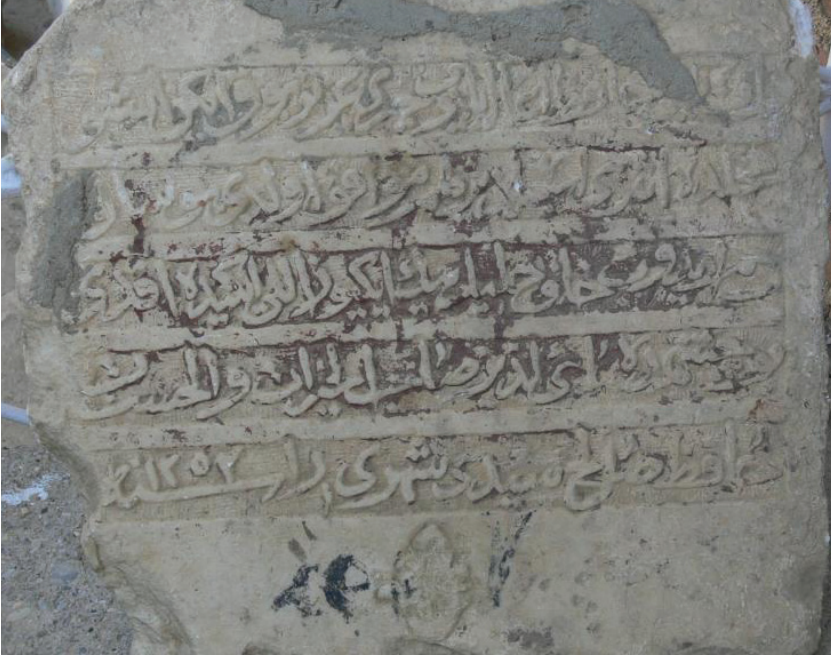
Kavacak Çeşmesi kitabesi

Helvacıköy çeşmesi: Çeşme şuan ayakta değildir. Kitabesi Şeref Ünal tarafında koruma altındadır. 1/Sahib ül- hayrat vel- hasenat 2/ "Ve segahüm rabbühüm şaraben tahüran" 19 3/ Kızılcaköylü 20 Hacı Hasan hayratı. Fi sene:20 Zilhicce 1311 21 . Kitabe boyutu: 30X40 cm.