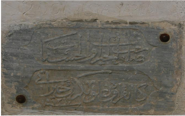
İncircik Çeşme kitabesi