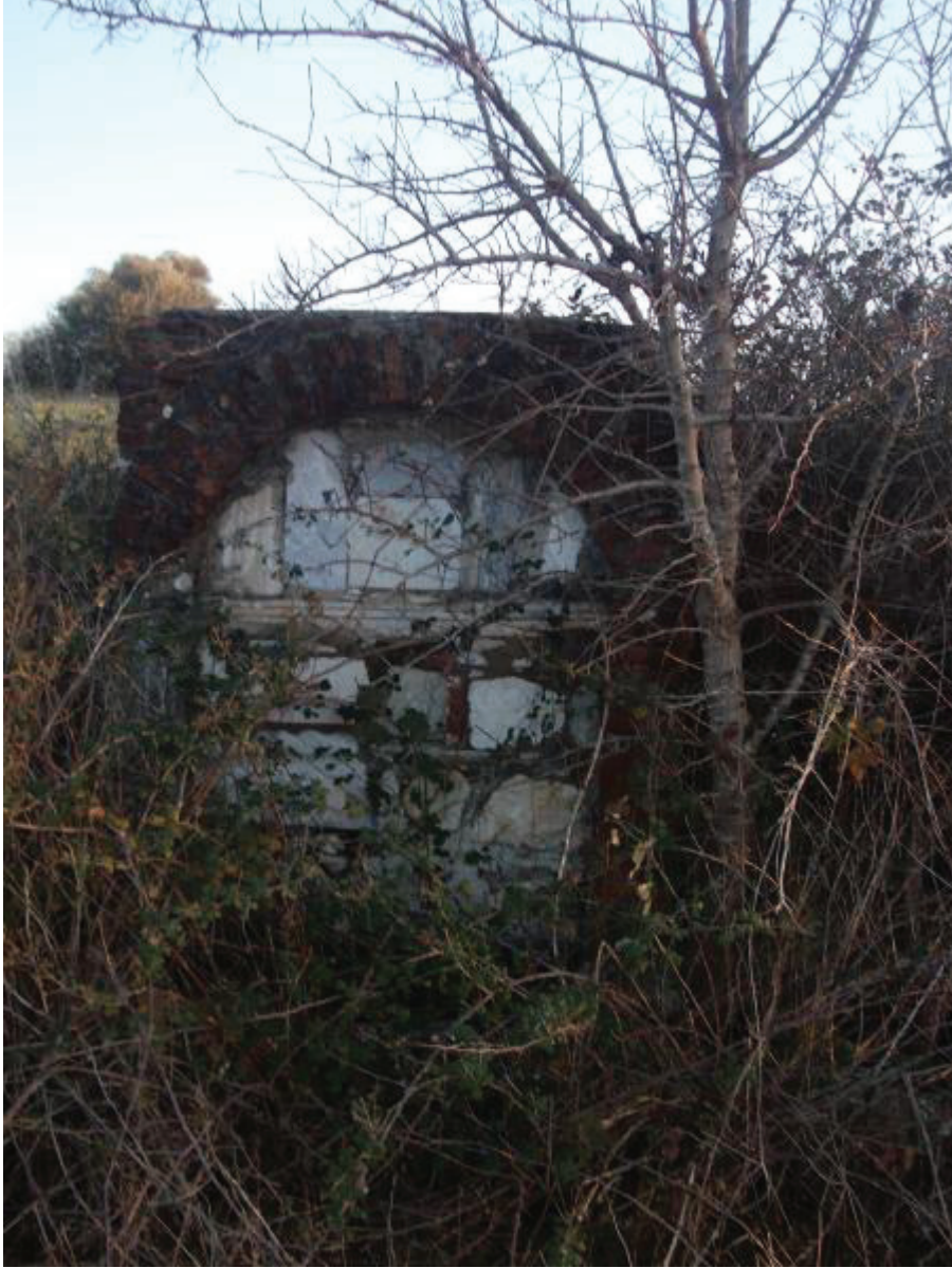
Demirciköy Kuru Çeşme