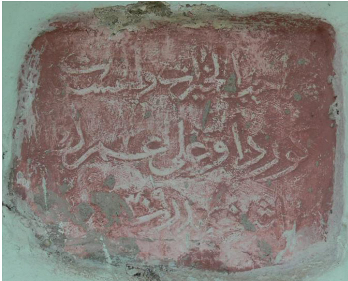
Kürt Ömer Çeşmesi kitabesi