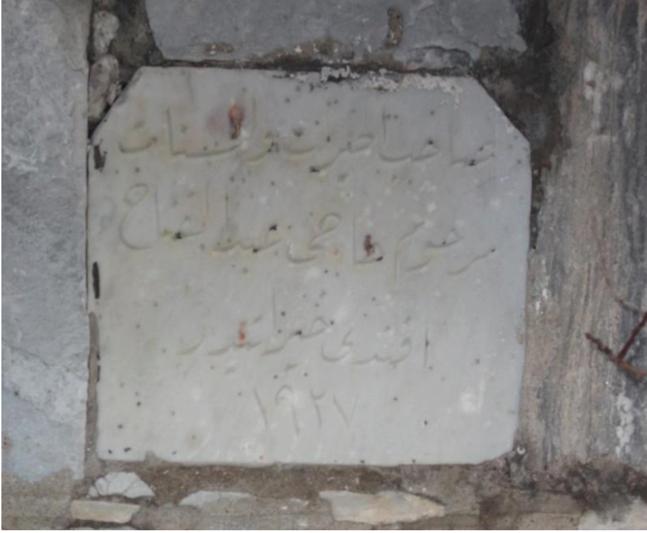
Demirciköy Kuru Çeşme kitabesi