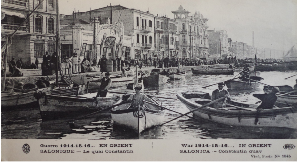
Ek 2: Selanik Rıhtımı'ndan bir görünüm, Selanik Makedonya Tarih Arşivi, ABE: 134, AEE Foto 2-02