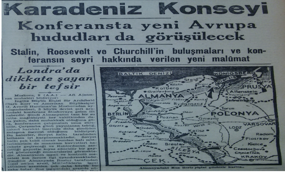
10 Şubat 1945 tarihli Tanin gazetesi