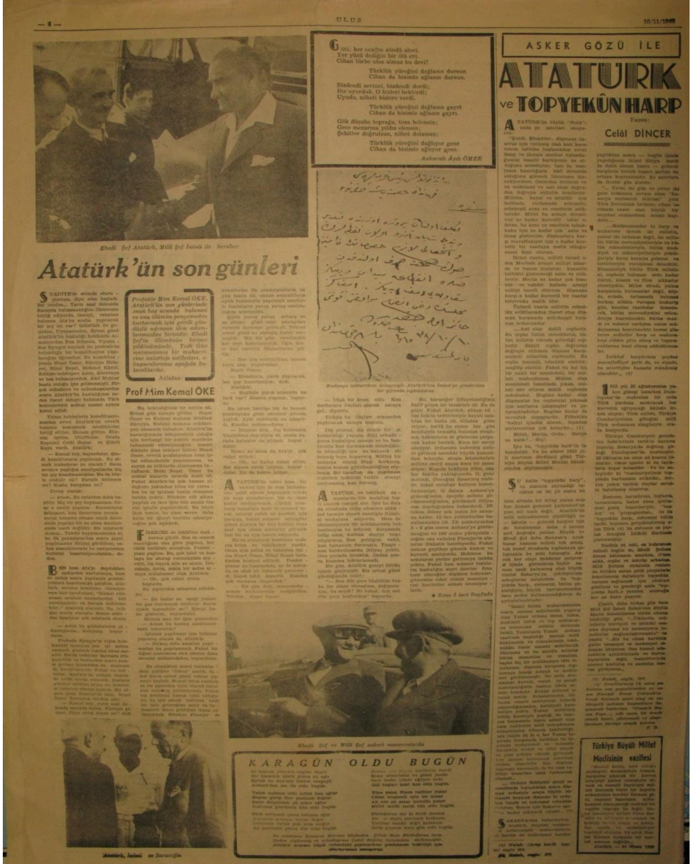
Ek-1: "Atatürk'ün Son Günleri", Ulus , 1943, s.4-5.