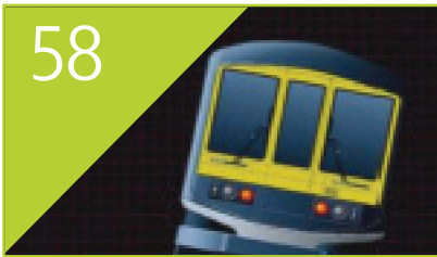
58 Demiryollarında Geçiş Eğrileri ve Dever Uygulamaları Adem ÇOŞKUN