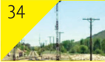
34 Tarihsel Süreç İçerisinde Demiryolu Trafik Yönetim Sistemlerine Yüzeysel Bakış Çağdaş GÖRGÜLÜ