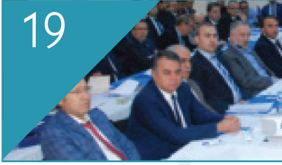
19 Datem'de İlk Ar-Ge Çalıştayı