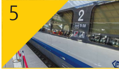
5 'Dünya'da Raylı Sistemler.'