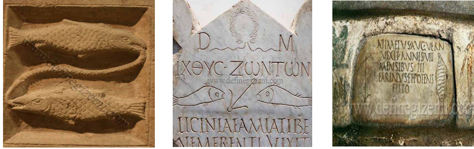
Şekil 1. Lahit ve katakamplarda bulunan çeşitli balık motifleri [3].

Balık figürü, Erken Hıristiyanlık dönemlerinde gizli sembol olarak kullanılmış, ilk kez katakamp mezarlarından rastlanılır. Hıristiyanlık önce mitolojilerde Tanrıça Afrodite'nin de sembolü olarak ta söylenmektedir. Yunanca'da kelime olarak ΙΧΘΥΣ veya ΙΧΘΥC şeklinde yazılır. Aynı zamanda kayalar üzerinde rastlanması da mümkündür. Bu yazı görüldüğünde balık diye okunur. Balık sembolü mezarları, gizlenmiş bölümlerin sembolü olarak konumuzu ilgilendiren kısımdır. Balık varsa orada zemin altı mahzen, katakamp, zemin altı mezarlar vardır. Bu mezarlar kıymetlidir. Anadolu'da bu tiplerin halen gün yüzüne çıkmadığı bilinmektedir. Katakamplar erken Hıristiyanların gizli ibadethaneleriydi. Bunlar genelde kayalık mevkilerde zemin altına yapılırdı [3].