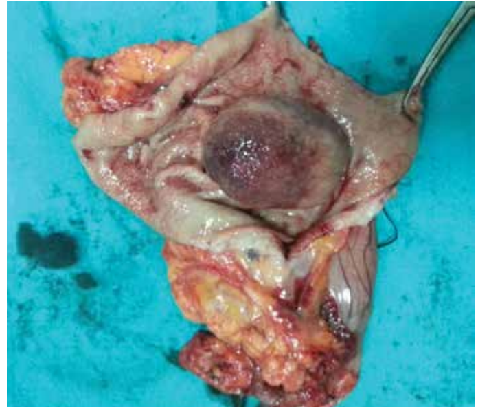
Resim 3. İntussepsiyona bağlı gelişen iskemik değişiklikler, rezeksiyon materyali

açıldığı gözlemlendi. Çekilen batın tomografisinde, midenin prepilorik bölgesinden duodenuma uzanan yaklaşık 5x4 cm çapında, düzgün sınırlı, çevre dokulara invazyon bulgusu göstermeyen, obstrüksiyona neden olan kitlesel lezyon izlendi ve kitlenin tekrar gastroduodenal intussepsiyona neden olduğu anlaşıldı (Resim 1). Hasta nütrisyonel destek tedavisi sonrası gelişinin 8. gününde mide GİST ön tanısı ile ameliyat edildi. Ameliyatta mide antrumunda küçük kurvatur duvarının duodenuma prolabe olduğu görüldü. Minimal traksiyonla duodenuma prolabe kitle rahatlıkla prepilorik bölgeye redükte edilebildi (Resim 2). İntussepsiyona neden olan patolojinin mide antrumda lokalize submukozal kitle olduğu anlaşıldı. Hastaya antrektomi yapıldı (Resim 3) ve ameliyat sonrası 6.günde sorunsuz taburcu edildi. Histopatolojik incelemede CD117 ve CD34 kuvvetli pozitif (+++) GİST saptandı. Mikst hücre paterni olan tümörün mitotik indeksi 3/50 büyük büyütme alanı (BBA) idi. Ki-67 indeksi %7,2