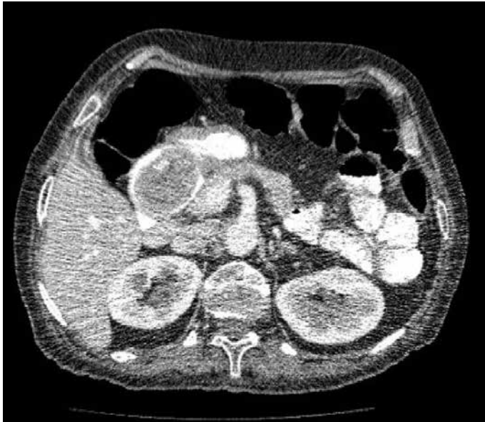
Resim 1. Bilgisayarlı tomografide duodenuma prolabe olmuş mide GİST'i