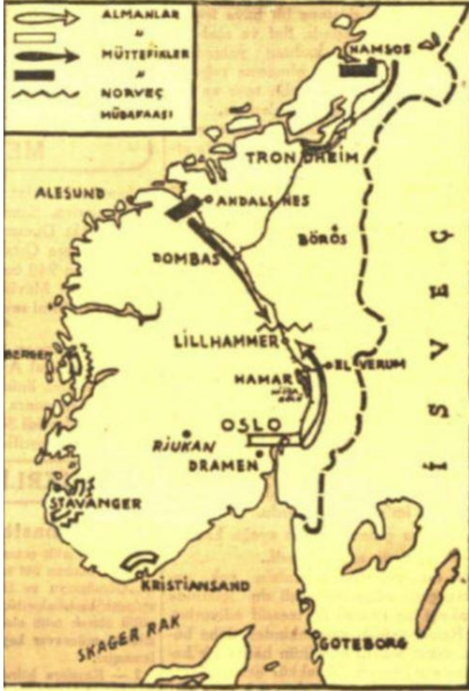
Ek 3. Norveç'in işgalini gösteren bir harita.