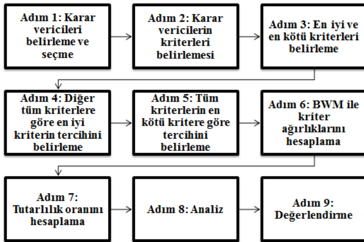
Şekil 2: BWM Araştırma Akış Şeması

Adım 6. Tutarlılık oranının hesaplanması: Karşılaştırmaların tutarlılığını kontrol etmek ve sonuçların güvenilir olup olmadığını anlamak için hesaplanır. Tutarlılık oranı ne kadar küçük olursa karşılaştırmalar o kadar tutarlı olur (Demir ve Bircan, 2020). Rezaei (2015) bir karşılaştırmaların ne kadar tutarlı olduğunu belirtmek için bir tutarlılık oranı önermiştir.