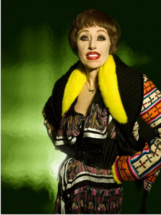
Görsel 5. Cindy Sherman, 2008 Untitled #458

yüzlerin boyanma biçiminin bir tabloyu hatırlattığını söylemek oldukça mümkündür. Fakat Sherman bu boyama şeklinin aktarımını bir tablo olarak sunmak istememiş, bir sanatçının sadece iç dünyasında yaşattığı, kurguladığı ve aktardığı canlılığı tablonun sınırlarıyla belirlenmiş bir imge olarak görünmesinden önce onun hayatta olan, fotoğraflanma anından sonra da hayatına devam edeceğini bilmemizi istediği bir paylaşımına yönelmiştir. Sherman'ın yaşadığı sorunun kanlı canlı hayatta olduğu ve hayatlarına devam ederken her an karşılaşabileceğimiz belki de karşılaştığımız kişiler olmasını istediği izlenimi bırakmaktadır (Görsel 5-6).