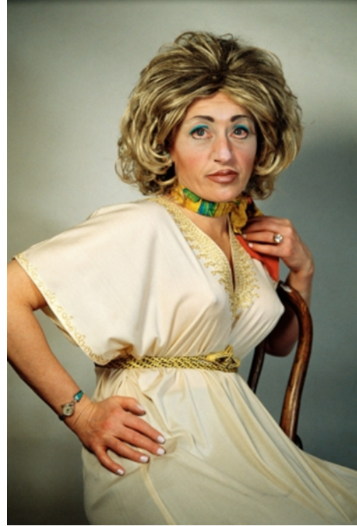
Görsel 6. Cindy Sherman, 2000 Untitled #353

Sherman'ın yarattığı ya da seçtiği karakterlerin sunumu bir anıt çalışması titizliği içerisinde gerçekleşir. Her fotoğraf karesini kamusal alana inşa edilecek bir anıt gibi sunar. Kadınlar dünyasını hatırlatma konusunda algının maruz kalacağı bir boşluk bırakmaz. Bütün bu titizlik ve kurguları onun için hayal dünyasında keşifler yapma yolculuğu sonucu gibi değil, fakat yürür gibi, bir merdiveni çıkar gibi çok doğaldır. Her an gerçektir ve Dostoyevski'nin dediği gibi "benim için gerçeklikten daha fantastik ne olabilir ki?" sorusu bütün benliğini adadığı tek bir konuda -ruhlarını beden üzerinden anlatmaya çalıştığı kadınlar dünyasında- karşılığını bulur. Sanatçıların, tartışmalı bir genelleme olsa da fantastik dünyasında sanatçıdan daha çok sanatçı olma tuzağına düşmeyecek kadar gerçeklikten yana olan Sherman'ın kadınları hep olduğu gibi görünür. Olduğu gibi görünmek istemiyormuş izlenimi bırakan kadınlar bile olduğu gibidirler. Güçlü olanın görülmesi gibi, beklenen ya da kabul edilebilecek karakter bütünlüğünü koruyamamış ya