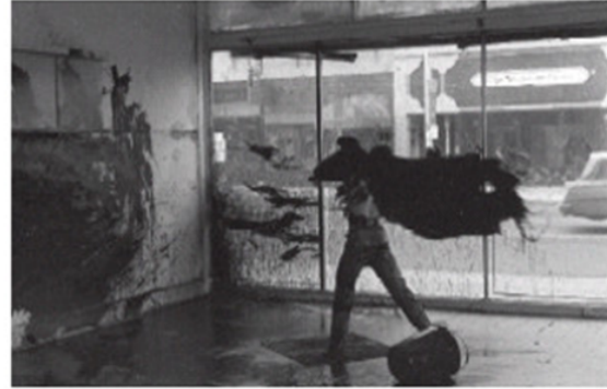
Görsel 9. Paul McCarthy performs Whipping a Window and a Wall with Paint in 1974, just as chess Grand Master Bobby Fischer walks passed. As reproduced in our new Paul McCarthy monograph (uk.phaidon.com)

İnsanlarla ilişki kurma ve onu devam ettirebilme, tanıyabilme ve tanınma için gerekli izleme ve izlenme protokollerinin rahatsızlığını klasik anlamdaki masal ve oyuncak imgesi kullanarak ürperti verici, bazen de tiksindirici bir kurguyla anlatır (Görsel 10-11). McCarthy'nin eserlerine bakmak, rahatsızlık hissetmeden izlemeye dalmak kolay değildir. McCarthy'nin eserlerine karşı verilen tepki çeşitliliğinden de bahsetmek