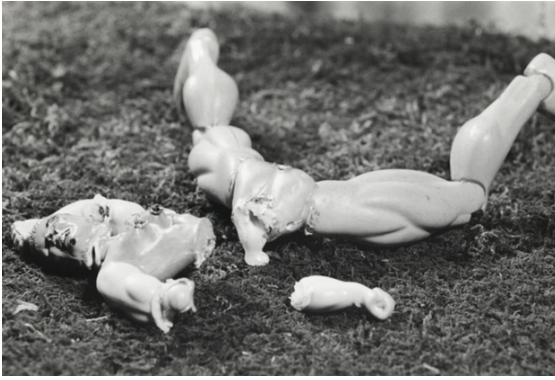
Görsel 3. Cindy Sherman, 1999, Untitled #342 (wikiart.org)

Yaşamı kontrol edebilen figür tasvirleri daha sonraki yıllarda kontrolden çıkmış, hayatı kontrol mücadelesinde, şekil değiştirmiştir. İlk dönem fotoğraf eserlerinin hemen hepsinde objektife, yani kendisine bakana bakmayan, mimiksiz, kimine boy hizasından kimine aşağıdan bakılmış kadınlar görülür. Sherman'ın kadınları, bir kişiden fazla insanların olduğu zaman geçerlilik kazanan ahlak anlayışında erkeklerin kadınları nasıl görmesi, tanınması gerektiği konusundaki karar vericilik güçlerini elinden alan kurgular sunar. Varoluşlarının özgünlüğü ve güçleri elinden alınacak kadınların cinsel objeye dönüşmesi hâlinde mekanikleşecek, cansızlaşacak ve parçalanacak kadın görünüşü için Sherman'ın verdiği cevaplardan birisi de uzuvlarının yerleri değiştirilerek bir araya getirilmiş farklı bir tür olarak adlandırabilecek tuhaf, rahatsız edici kadın kuklalarıdır. Eşitsizleştirilmiş mücadelenin sonucu erkek egemenlik gücünü kullanarak cinsel ilişki girişimi karşısında fiziki olarak Sherman'ın kadın kuklaları vardır (Görsel 3-4).