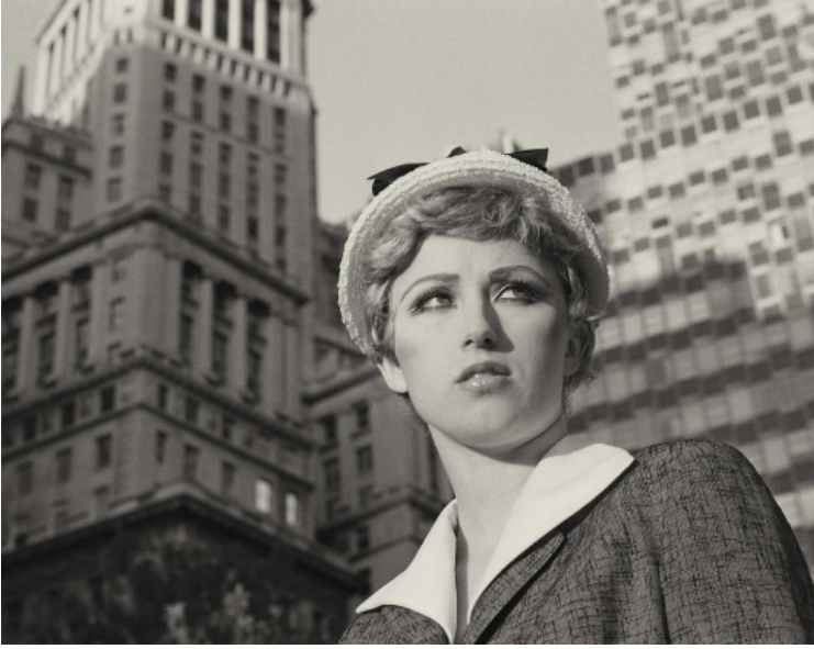
Görsel 1. Cindy Sherman, Untitled film still (#21)

Cindy Sherman'nın ilk dönem fotoğraflarındaki tek başına kadın figürleri Kucuradi'nin “Ahlak bir kişiden fazla insanların olduğu zaman geçerlilik kazanmaya başlıyor” sözünün gerçekliğini son dönem eserlerindeki dönüşüm ile tamamlamaya devam etmektedir. Figürlerin yalnızlığı ahlaki sınırlar içerisine hapsedilmişlik izlenimi bırakmaz. Karşı cins tarafından tek ve ortak kadere dönüştürülmek istenen kadınların bakışlarından, kostümlerinden, buldukları mekânda tek başına ayakta durabilen güçlü kadın izlenimi bırakır. Uzağa, hedefe bakarlar ve kararlılıkları bakışlarından anlaşılır (Görsel 1-2).