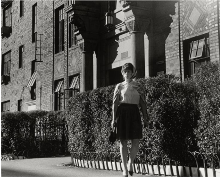
Görsel 2. Untitled film still #18, 1979 black and white photograph black, 1978