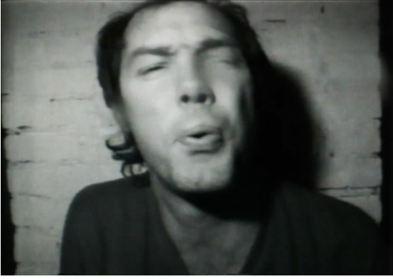
Görsel 7. Spitting on the camera lens, 1974