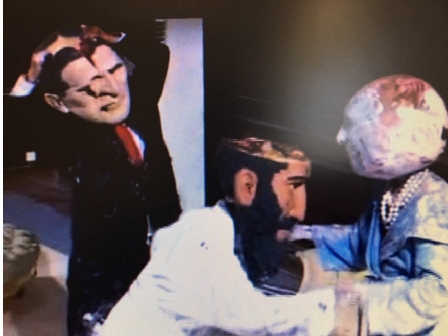
Görsel 10. Artist Paul McCarthy describes the improvisational process and performances behind the video work Piccadilly Circus (2003)