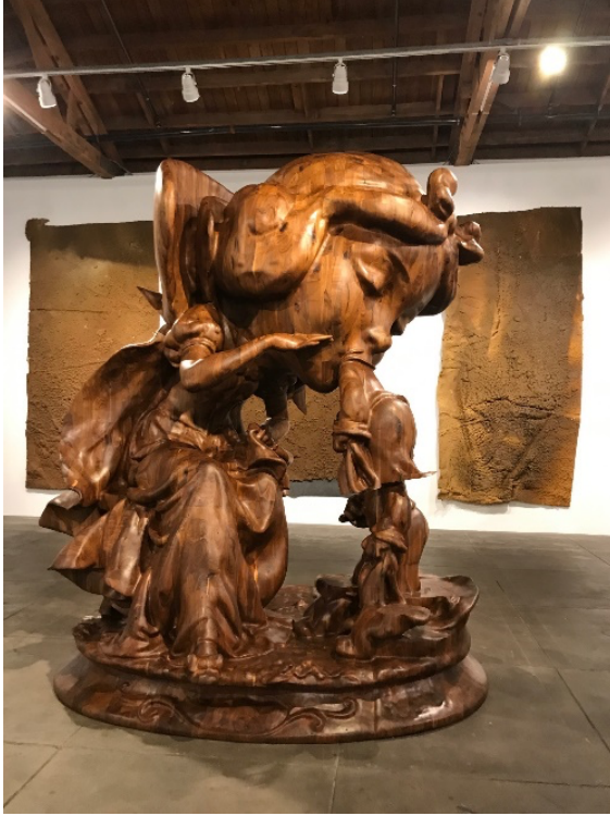
Görsel 11. Paul McCarthy, WS, White Snow Dopey Dopey Head, Ten Feet, 2013-2014. Black walnut