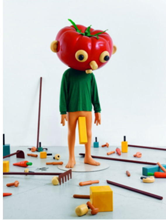
Görsel 12. Paul McCarthy, 1994, Tomato Head (Green) (irequireart.com)