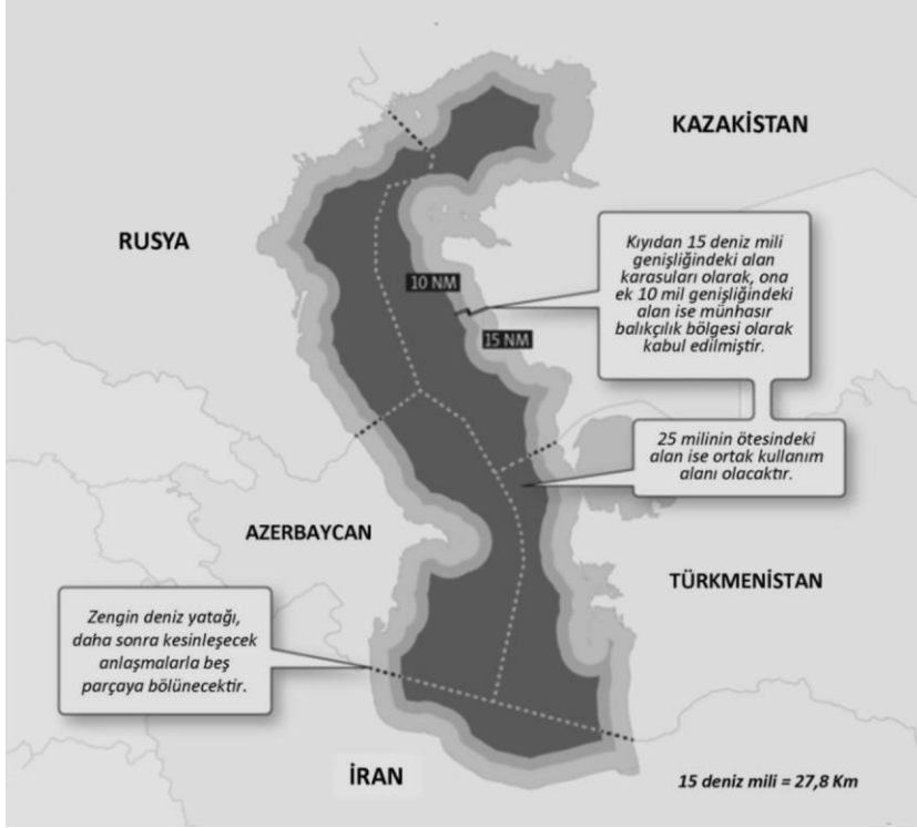
Şekil 2: Hazar Denizi'nin Hukukî Statüsü Konvansiyonu'na göre Hazar Denizi'nin Paylaşımı