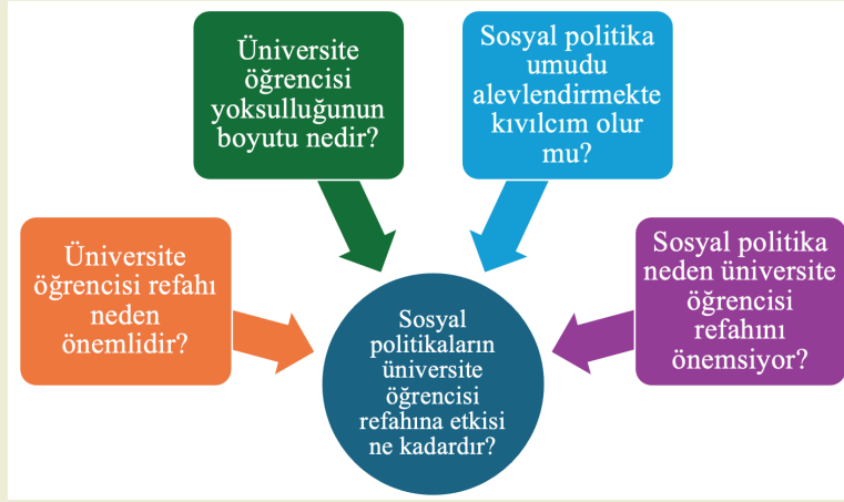
Şekil 1. Problem Tasarımı

rının sistemi tehdit edecek noktaya ulaşması sebebiyle yine sistemin kendisi tarafından emekçilere verilen bir takım haklar olarak ortaya çıkmış olan sosyal politika bu yönü itibarıyla verilen bir ödündür. Sosyal politika sermayenin sınırsız sömürsünü dizginleyebilmek adına yine liberal siyasi düşünce sistemi içerisinde piyasaya devlet tarafından müdahale edilmesini öngörür. Bu noktada aslında bir yönetim modeli olarak da tanımlanabilir. Adil ve eşitlikçi bir yaklaşımıyla tüm insanların refahını piyasada araması yerine devlet tarafından asgari düzeyde sağlanması sosyal politikanın temel ahlaki düzlemidir (Öçal, 2022: 5; Tokol, 2000: 7; Seyyar, 2007: 395; Koray, 2007: 43; Göze, 2016: 236; Durusoy-Öztepe, 2020: 15).