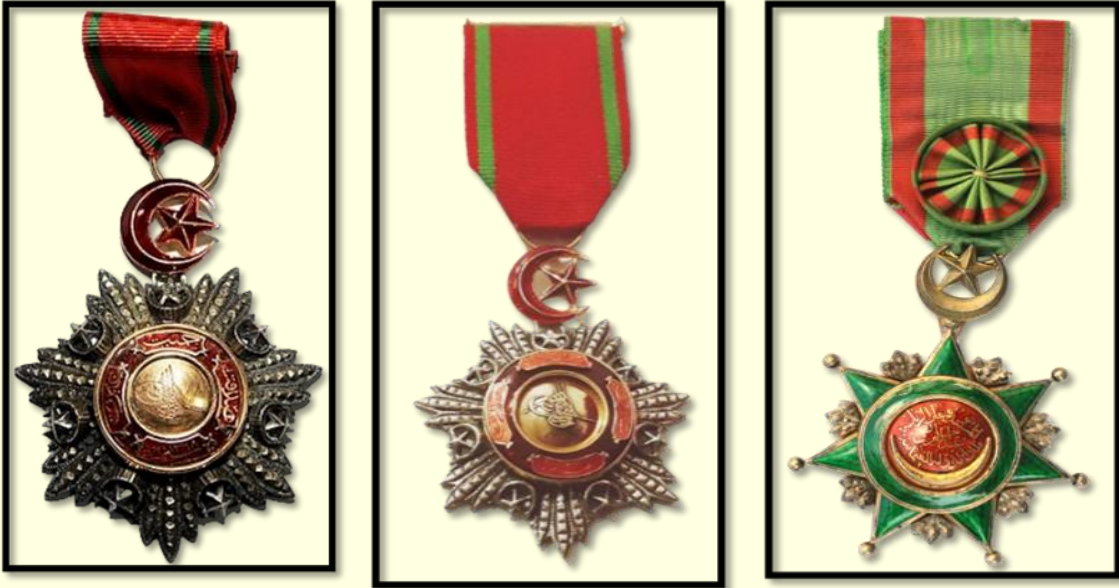
5. Rütbe Mecidi Nişanı

Osmanlı döneminde taltif için verilen nişanlar özel bir tasarıma sahip olduğu dikkatlerden kaçmamaktadır. Araştırma kapsamında memleket tabiplerine verilen nişanların görsellerine de yer verilmiştir 8 (Şekil 2).