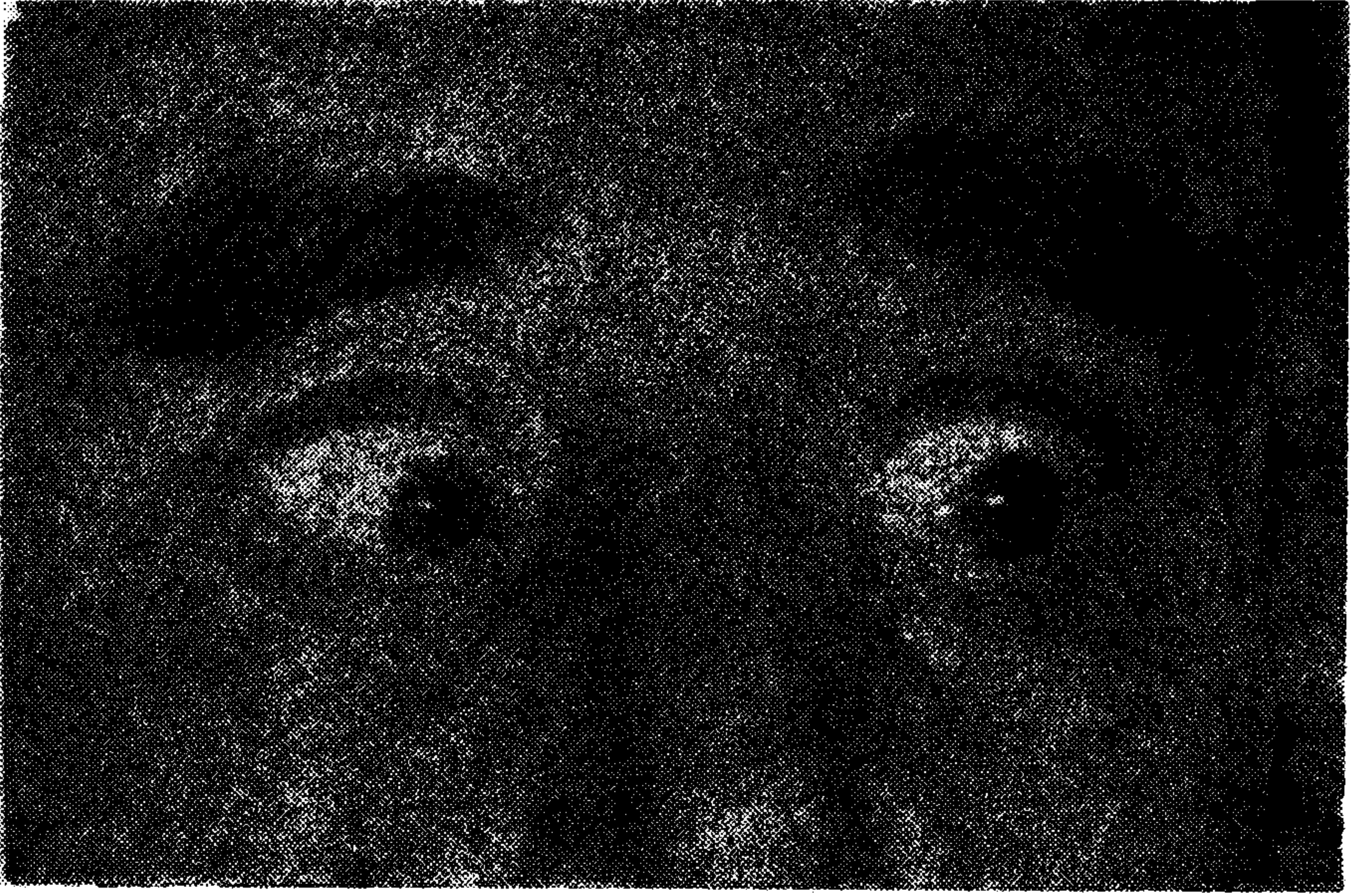
Resim 2. Sola konjuge bakış.