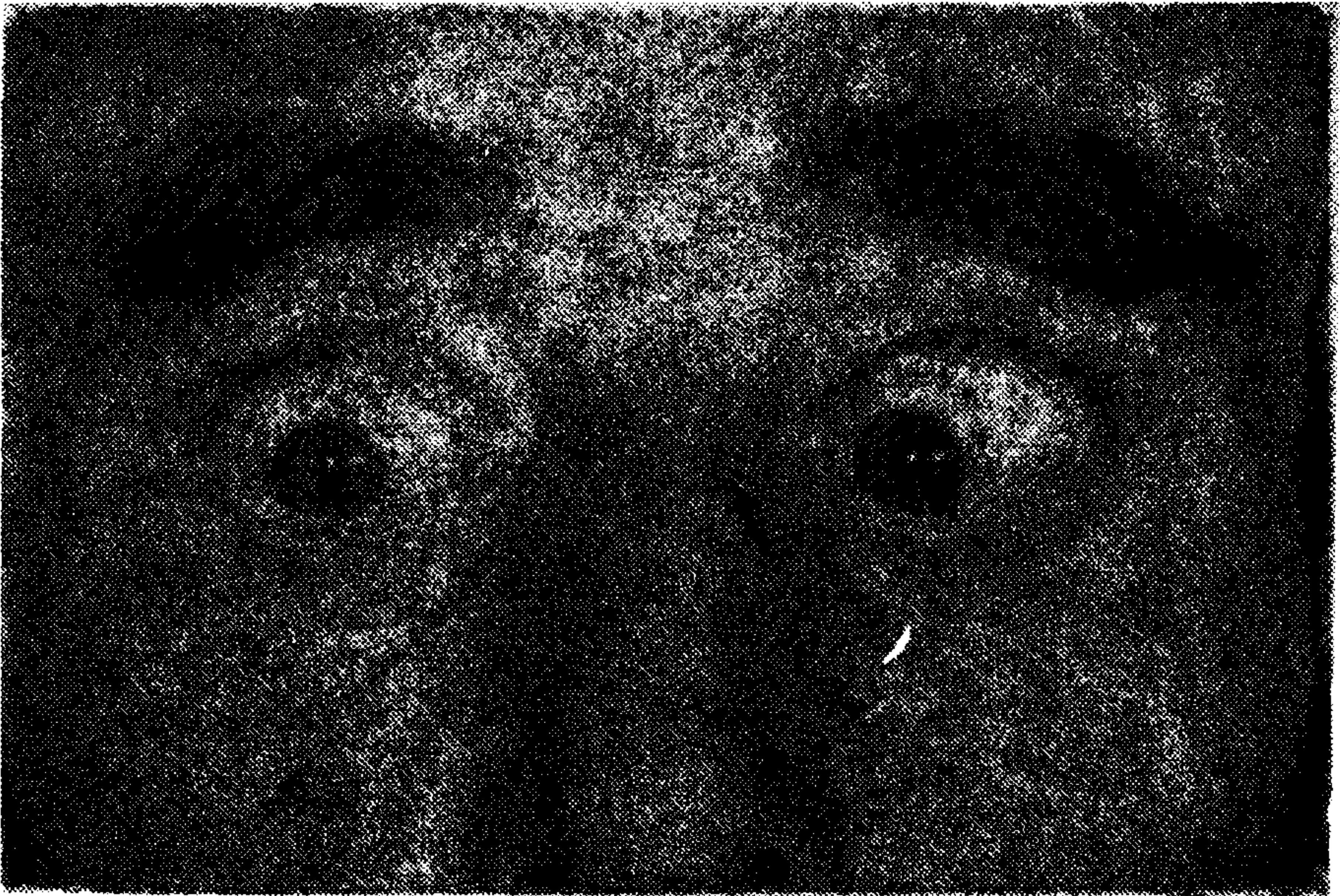
Resim 3. Sağa konjuge bakış.