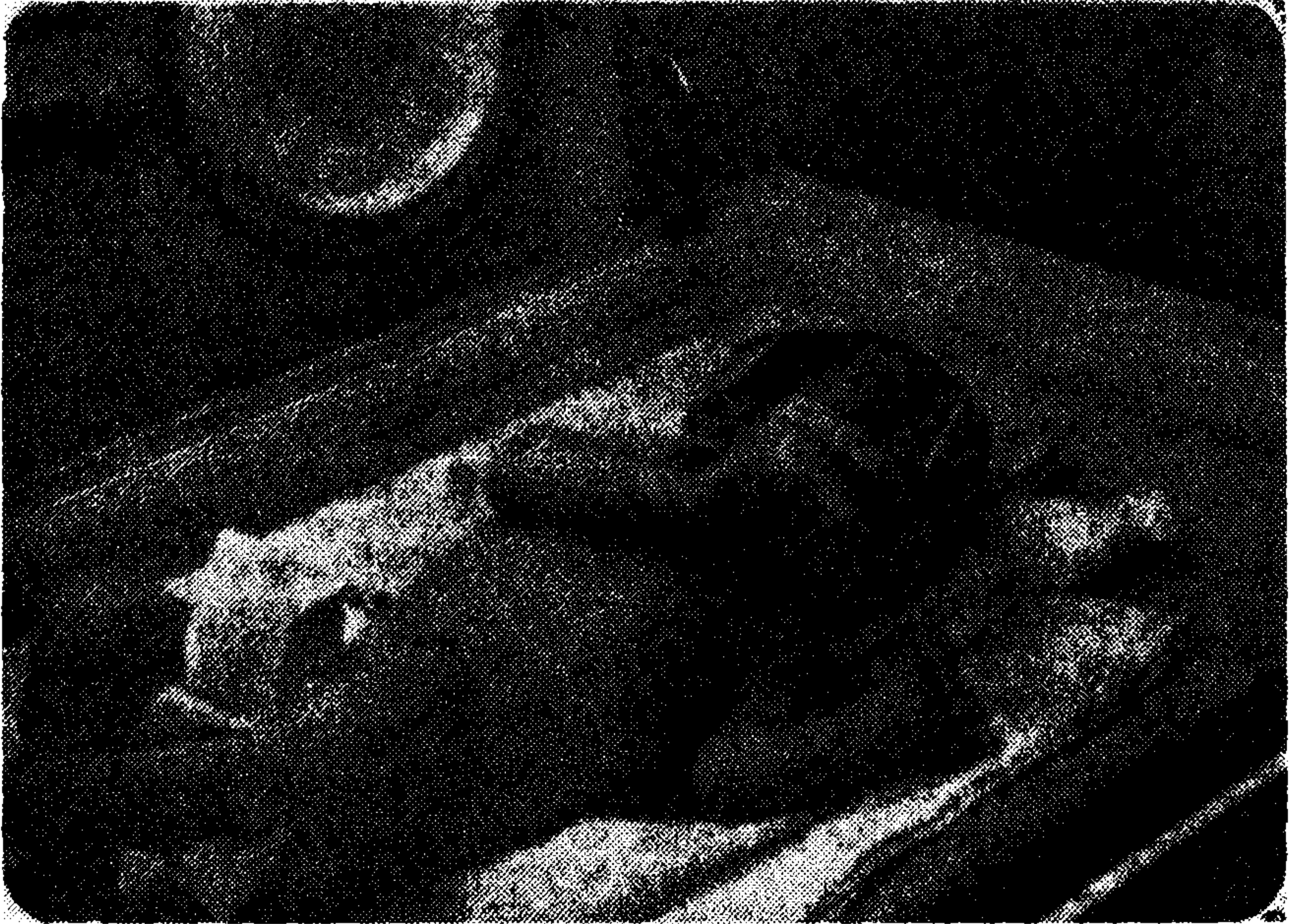
Resim 1. Airway takılmasından sonra bebeğin küvözdeki görünümü.

Ağızda airway bulunan bebek bir süre orogastrik gavaj ile beslendi. 25 inci günde oral beslenmeyi tolere eden bebek aylık kontrollara gelmek