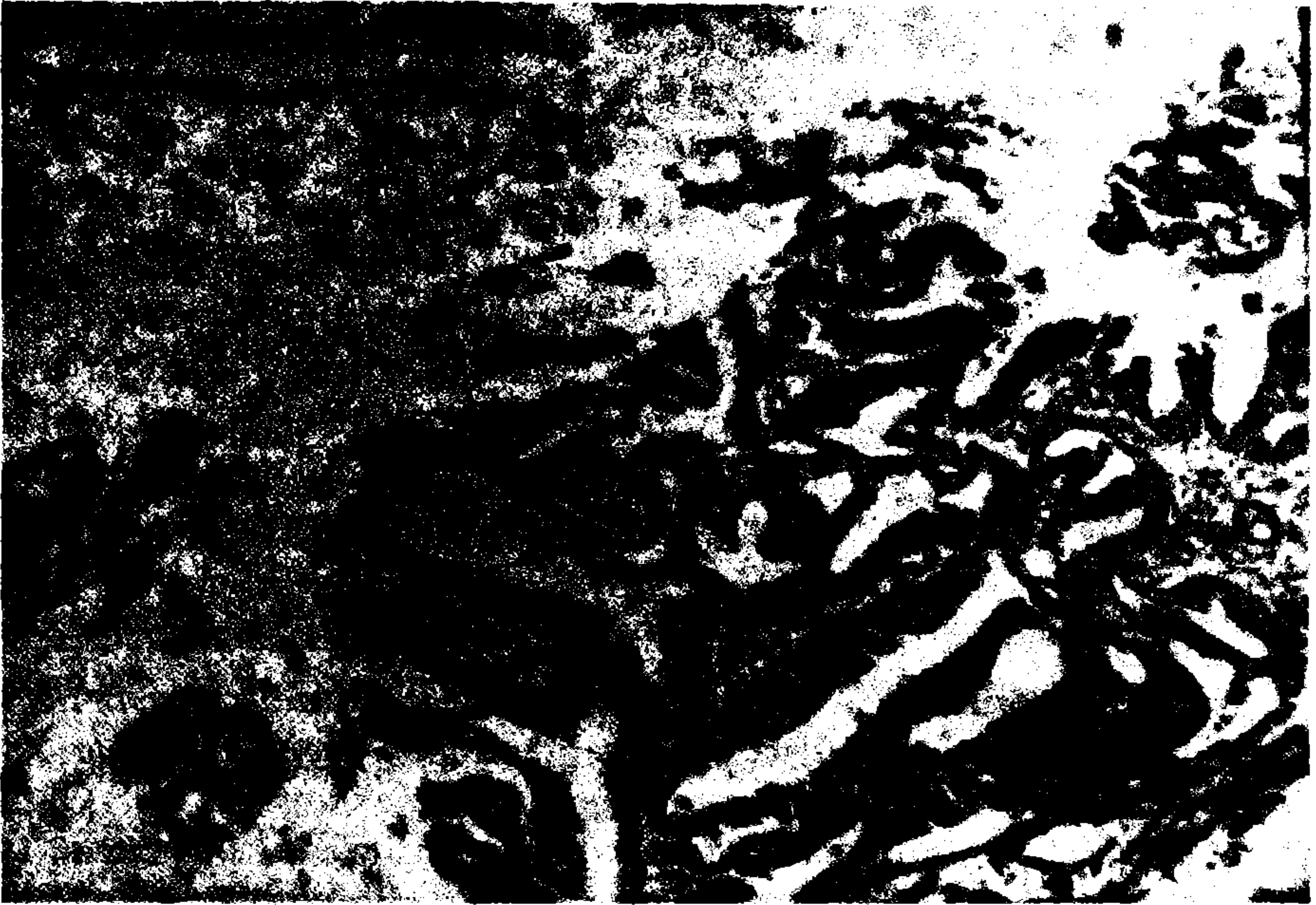
Resim 2. Histolojik kesitlerde uniform duktus epitel hücrelerinin döşediği düzensiz adenoid yapılardan ibaret papillomatöz oluşum izlenmektedir. Lumende geniş stoplazmalı duktus epitel hücreleri görülmektedir (H+E= 10x16).

A.H. 64 yaşında, erkek. Prot. no:271, 4 yıldır sol memesinde şişlik ve 1.5 yıldır da aynı taraf meme başında kanlı akıntı şikayeti var. Fizik muayenesinde, sol meme üst dış kadranda 3x4 cm boyutlar ında, sert kıvamlı, hareketli, yüzeyi düzgün ve ağrısız bir kitle saptandı. Bölgesel lenfadenomegali yoktu. Lokal anestezi ile kitlenin tamamı çıkartıldı. Piyenin histopatolojik incelenmesinde intraduktal papillomatosis saptandı (pat. rapor no:197-89), Resim 2. Hasta ameliyatın 4. günü taburcu edildi.