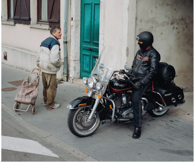
Görsel 2: Emgreen & Dragset tarafından küratörlüğü yapılan 15. İstanbul Bienali. grafik tasarım: Rupert Smyth.

Bienalde yer alan işlere tek tek değinmek sınırlı bir yazı alanında çok mümkün değil; fakat bienalde yer alan işlerin hepsine değinmek zaten gerekli de değil. Çünkü bienalin içerdiği işlerin kötü ve en kötü arasında bir ortalamaya sahip olduğunu rahatlıkla söylemek mümkün. "İyi Bir Komşu" teması, bu coğrafyanın komşuluk ilişkilerine dair vurgu yapılması açısından belki cazip görünmüştü: Ama bu "komşuluk ilişkileri nerede kaldı?" sorusunu da beraberinde getirir: Tüm bireysel ilişkilerin çıkar ilişkileri odaklı kurulduğu çürüyen bir toplum yapısında bundan bahsetmek ve bunun nostaljisini içeren işler üretmek ne kadar hedefe ulaşabilir? Öte yandan, birçok etnik topluluk ve ülke artık yakın komşu değiller, bazıları sınırların dışında komşular haline geldi. Öte yandan toplumsal ilişkiler de, kimlik siyasetinin günlük, geçici ve ideolojik olarak yanlış konumlandırılmış popülist-politik söylemleri içerisinde aşınmış durumda. Peki, bu politik düzlemde sanatın dilinin önerdiklerini nereye koyabiliriz?