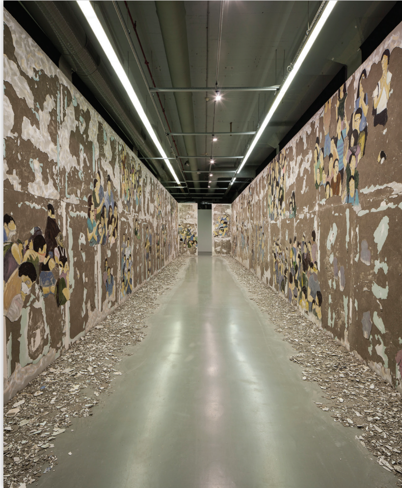
Görsel 3: Latifa Echakhch, Silinen Kalabalık , 2017

İstanbul Bienali, Türkiye'deki politika ve sanat sahnesinin, jeopolitik konularda kendisini nereye koyacağını bilemeyen iki arada bir deredeki konumunu, sanatın diliyle ironik ve mesafeli bir tutumla görünür kılmayı tercih etti. Küratörler Elmgreen & Dragset'in, daha çok günlük yaşamı ele alan ya da komşuluğu doğrudan bireysel deneyim üzerinden tarif eden sanatçıları ve yapıtları seçtikleri açık bir biçimde gözlemlenebiliyordu. Fakat bu tespit bizi, bienalde yer alan 56 sanatçının işlerinin, kamusal projelerin ve birçok yan etkinliğin bir politik dili olmadığı düşüncesine de götürmez. Pera Müzesi'nde çalışması yer alan Fred Wilson'ın, Osmanlı ve Türkiye tarihinde Siyah ve Afro-Türk kimlikler üzerine çalışması; Fas asıllı Fransız sanatçı Latifa Echakhch'in İstanbul Modern'de yer alan duvar resmi; ve Victor Leguy'un Fener bölgesinde yer alan bir mekân üzerinden mülteciler ve onların hikâyelerine dair nesnelere barındıran çalışması, politik bir duruşun her halükarda gösterilebileceğini ispatlama açısından önemli. Buna Sim Chi Yin'in göçmenlerin düşük ücretli olarak Pekin'de bodrum katlarında, penceresiz odalarda yaşamlarını gösteren fotoğraf serileri de eklenebilir. Peki, bunlar yeterli miydi?