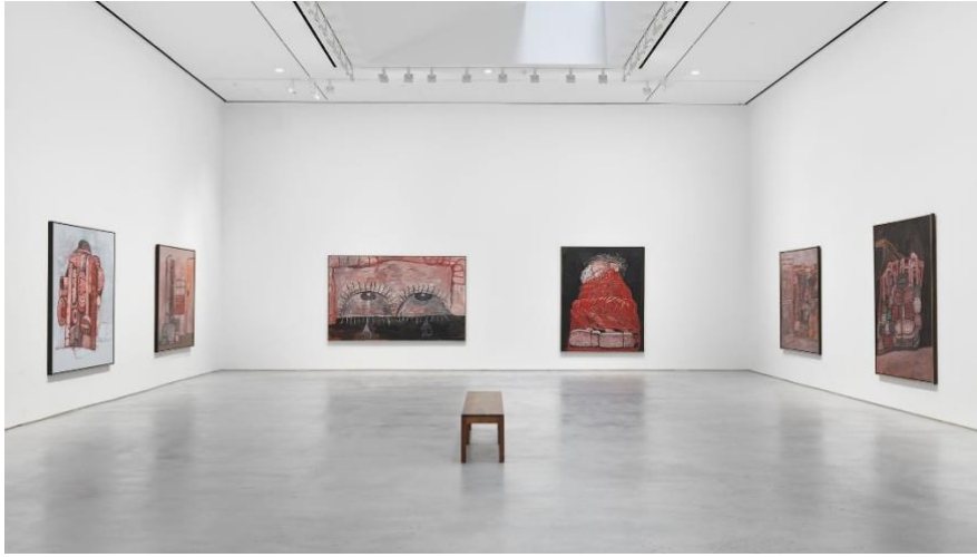
Görsel 12. Philip Guston. 1969-1979, Hauser & Wirth, New York.

Sonuç olarak, Guston'ın Klansmen Serisi, rahatsız edici gerçeklerle yüzleşmek ve mevcut duruma karşı durmak için sanatın dönüşüm potansiyelinin güçlü bir örneği olarak öne çıkmaktadır. Irkçılık ve bağnazlıkla ilgili cesur irdelemeleri ile Guston, izleyicileri insanlığın karmaşık doğası yüzleşmeye, daha adil ve eşit bir dünya için çaba göstermeye teşvik etmektedir. Klansmen Serisi, ırk eşitliği ve sosyal adalet mücadelesinin devam eden önemini hatırlatmakta ve bıraktığı etkiyle hem tarihsel hem de çağdaş bağlamda geçerliliğini sürdürmektedir. Guston'ın zor konuları cesurca irdelemiş olması, sanatçılara, aktivistlere ve akademisyenlere ırk, kimlik ve insan deneyiminin karmaşıklığı üzerine anlamlı diyaloglar kurmaları için ilham vermeye devam etmektedir. Bu seri, çağın sanatının düşünceleri harekete geçirme, varsayımlara meydan okuma ve bölgesel sorunlarla yüzleşme konusundaki dönüşüm gücünün bir göstergesi olarak ortaya çıkmaktadır. Guston, cesaret isteyen zor konuları araştırarak izleyicileri toplumsal gerçeklerle yüzleşmeye ve daha adil bir geleceği hayal etmeye davet etmiştir (Görsel 12).