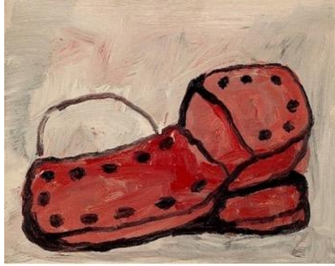
Görsel 4. Ayakkabılar/Shoes , Guston, P. (1968).

Guston'un farklı zamanlardaki kendini yeniden keşfetmesi, soyut dışavurumcu köklerinden kaçınarak kendi kaygılarına yönelmesi cesur bir sanatsal temsil olarak görülebilmektedir (White, 2017). Guston'un figüratif sanatı etrafındaki tartışmalar, akademik çekişmeleri ve eleştirel söylemi besleyerek, eserlerinin düşündürme gücünü ve önyargılara meydan okuma niteliğini vurgulamaktadır. Bu sayede, Guston'un figüratif sanata yönelmesi, soyutlama ile temsil arasındaki kesişimi keşfetmeye çalışan gelecek nesil sanatçılar için bir ilham kaynağı olmaktadır.