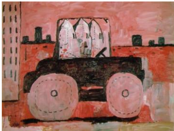
GörSEL 9. Şehir Sınırları/City Limits. Tuval Üzerine Yağlı Boya, Guston, P. (1967).

Guston'un sanatında yer alan kuklaları olan Klan mensupları, ırkçılık, bağnazlık ve beyaz üstünlüğü gibi temaların güçlü sembolleri olarak öne çıkar. Serinin temel motifi, Guston'un karakteristik karikatür tarzıyla tasvir edilmiş kuklalardır. Bu figürler genellikle gündelik aktivitelerle ilgilenirken veya içsel bir sorgulama anında tasvir edilmekte olup, izleyicilerin varsayımlarını ve klişelerini sorgulamaya yönlendirmektedir (Jacobs, 2020). Guston'un kuklaları metaforik bir alan sunmaktadır. Dolayısıyla figürlerin kukla oluşu yerine, bu figürlerin birer maskelenmiş birey, çelişkiler içinde bir insan veya toplumun kendi karanlık yüzüne bir ayna tuttuğu düşünülebilir (GörSEL 9).