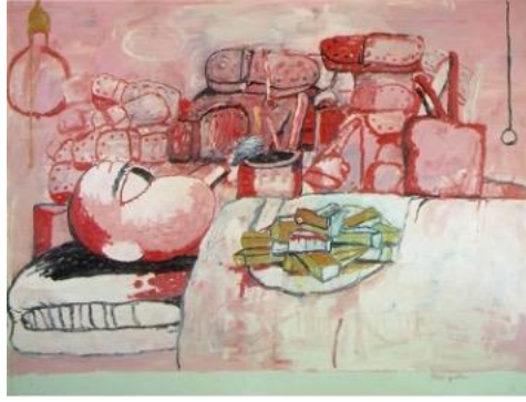
Görsel 5. Resim Yapmak, Sigara İçmek, Yemek Yemek/Painting, Smoking, Eating , Guston, P. (1972).

Serinin bir diğer teması, Yunan mitolojisinde genellikle canavarlık ve dışlanmışlıkla ilişkilendirilen tek gözlü bir karakter olan Tepegöz'dür. Tepegöz, Guston'ın kendi yabancılaşma, izolasyon ve varoluşsal umutsuzluk duygularının bir sembolü olarak işlev görmektedir. Guston'ın eserlerinde sıkça rastlandığı gibi, Tepegöz Serisi de karmaşık duyguları ve temaları yansıtmak için kara mizah ve ironi unsurlarını harmanlamaktadır (Baldwin, 2022). Guston'ın son dönem eserleri, sadeleştirilmiş formlar ve cesur, grafik tasarımlarla öne çıkmaktadır. Serideki figürler, Guston'ın yüksek ve düşük sanatın kesişim alanlarını araştırma arzusunu yansıtan karikatürize bir özellik taşımaktadır. Basit formlara rağmen, Guston'ın fırça tekniği dinamik bir şekilde etkileyici olmakta ve eserlere enerji ve hareket hissi kazandırmaktadır.