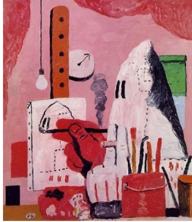
GörSEL 10. Atölye/The Studio, Guston, P. (1969).

Guston'un kara mizah ve ironi kullanımı, eserlere derinlik katmakta ve izleyicileri toplum ile insan doğasına dair rahatsız edici gerçeklerle yüzleşmeye çağırmaktadır. Klansmen Serisi, ırkçılık ve önyargı karşısında güçlü bir eleştiri işlevi görürken; aynı zamanda çağdaş toplumda yabancılaşma, korku ve moral belirsizlik gibi daha geniş temaları da incelemektedir (Boime, 2008). Başlangıçta, Guston'un imgeleri eleştirmenler ve izleyiciler arasında rahatsız edici ve tartışmalı bulunmuş, bu da kınamalara yol açmıştır. Ancak zamanla bu serinin resimleri, cesareti, özgünlüğü ve keskin sosyal yorumları sayesinde yeniden değerlendirilmeye başlanmış ve kabul görmüştür. Artık eleştirmenler ve akademisyenler, bu seriyi Guston'un en çarpıcı çalışması ve sanatsal dürüstlük ile hakikate olan sarsılmaz bağlılığının bir göstergesi olarak değerlendirmektedir (Stokes ve Fisher, 2005).