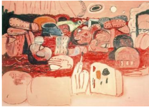
Görsel 6. Tufan/Deluge II , Guston, P. (1975).

Serinin bir diğer teması, Yunan mitolojisinde genellikle canavarlık ve dışlanmışlıkla ilişkilendirilen tek gözlü bir karakter olan Tepegöz'dür. Tepegöz, Guston'ın kendi yabancılaşma, izolasyon ve varoluşsal umutsuzluk duygularının bir sembolü olarak işlev görmektedir. Guston'ın eserlerinde sıkça rastlandığı gibi, Tepegöz Serisi de karmaşık duyguları ve temaları yansıtmak için kara mizah ve ironi unsurlarını harmanlamaktadır (Baldwin, 2022). Guston'ın son dönem eserleri, sadeleştirilmiş formlar ve cesur, grafik tasarımlarla öne çıkmaktadır. Serideki figürler, Guston'ın yüksek ve düşük sanatın kesişim alanlarını araştırma arzusunu yansıtan karikatürize bir özellik taşımaktadır. Basit formlara rağmen, Guston'ın fırça tekniği dinamik bir şekilde etkileyici olmakta ve eserlere enerji ve hareket hissi kazandırmaktadır.