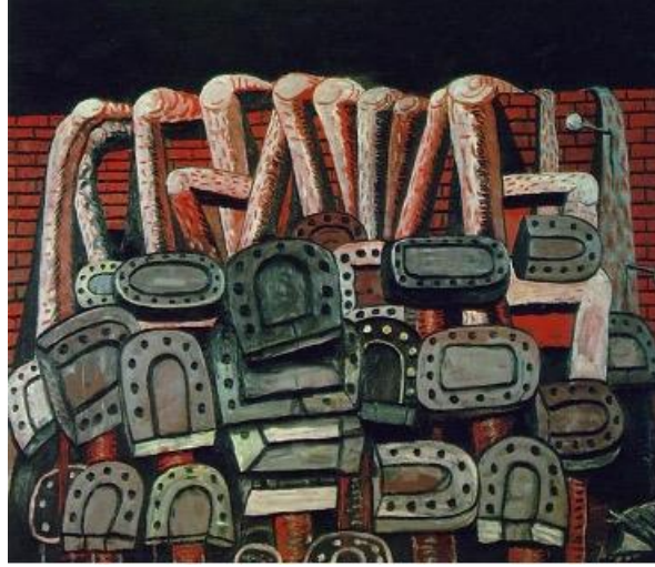
Görsel 7. Antik Duvar/Ancient Wall , Guston, P. (1976).

kırıklıklarını da yansıtmaktadır. Bu eserler, insan figürlerinden yoksun, ıssız ve tenha manzaraları içermektedir. Bu serideki resimlerde, at nalı formunu andıran ayakkabı ökçeleri, çivili beyzbol sopaları ve sandalye parçaları görülmektedir (Görsel 7). Bu nesnelere bir araya gelme amacı, dövülerek hayatını kaybeden insan kalabalıklarını temsil eden metaforik nesne natürmortları ile kenar mahallelerin derme çatma manzaralarını buluşturmaktır. Guston'ın yapıtlarında genellikle boş sokaklar, terkedilmiş binalar ve yalnız ağaçlar gibi öğeler yer almakta ve izleyicide rahatsız edici bir durgunluk ve sessizlik hissi oluşturulmaktadır.