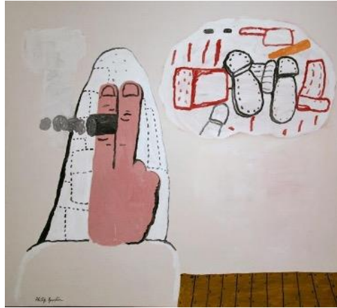
GörSEL 11. Gündüz Düşleri/Daydreams, Guston, P. (1970).