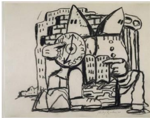
Görsel 3. İsimsiz/Untitled , Guston, P. (1968).

Bu dönemdeki en ikonik motiflerinden biri, genellikle sade ve ıssız manzaralarda betimlenen Ku Klux Klan maskeli figürleridir (Görsel 3) (Wilson, 2017). Guston'un figüratif çalışmaları, cesur, grafik kompozisyonlara ve basitleştirilmiş formlara dayanan karikatürize imgelerle karakterize edilmektedir. Figüre geçmesine rağmen, Guston, soyut çalışmalarını tanımlayan enerjiyi ve dışavurumcu fırça işçiliğini korumaktadır. Aynı zamanda, toplumsal normlara eleştirel bir bakış açısı getirmek ve geleneksel bilgelige meydan okumak için kara mizah ve ironiyi sıkça kullanmaktadır.