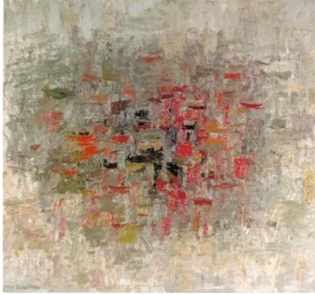
Görsel 2. B.W.T.'ye/To B.W.T. , Guston, P. (1952).

Guston'un erken dönem dışavurumcu eserleri, 20. yüzyılın ortasında Amerikan soyut sanatını etkilemede önemli bir rol oynamaktadır (Görsel 2). Bu çalışmalar, Guston'a sanatsal duyarlılıklarını keşfetmek için bir zemin sunmuş ve daha sonra figüratif bir yaklaşıma yönelerek ikonik Ku Klux Klan maskeli figürlerinin gelişimine temel oluşturmuştur (Wilkin, 2014). Philip Guston'un erken dönem dışavurumculuğu, sanatsal yolculuğunun evriminde önemli bir aşamayı temsil ederken, İkinci Dünya Savaşı sonrasındaki karmaşık yıllarda yeteneğini, yaratıcılığını ve sanatsal ifade sınırlarını zorlamaya olan bağlılığını ortaya koymaktadır. Guston'un bu dönemdeki eserleri, saf duygusal ifadeye odaklanan ve formların serbest bırakıldığı bir tarzla karakterize edilmiştir. Özellikle soyut biçimler ve renk alanları aracılığıyla ifade bulan bu dönemin eserleri, sanatçının derin bir içsel mücadele yaşadığını ve dünyayı soyut bir şekilde anlamaya çalıştığını gösterir. Bu dönem, onun figüratif resme geçişi için bir hazırlık niteliğindedir. Soyut sanatın kendisine sunduğu sınırsız ifade özgürlüğü, Guston'un daha sonraki figüratif çalışmalarında da gözlemlenen kişisel ve toplumsal eleştirilerin temelini oluşturmuştur.