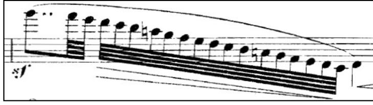
Şekil 3. Profesyonellik gerektiren inici nüans uygulamaları