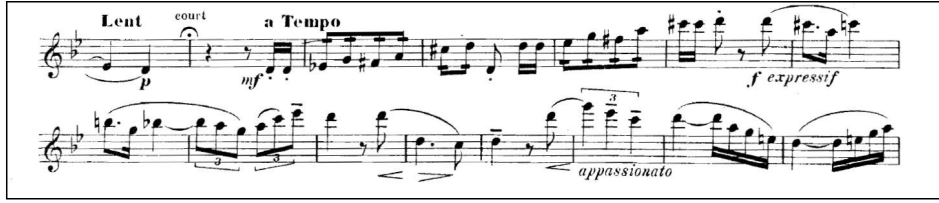
Şekil 9. Romantik müzik etkisi, pentatonik kullanımıyla ton geçiş köprüsü

istenen bu kısmın armonik yapısı, geniş kullanılan üçlemeler, tiz notalarda vibrato kullanımı isteyen appassionato motifler, dinamikler romantik müzik besteleme üslubunda kullanılan birkaç örneği içerir akabinde pentatonik duyumuyla tekrardan izlenimci Fransız flüt müzik tarzını duyurur (Şekil 9).