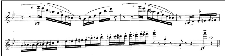
Şekil 11. Presto bölümünün kromatik çıkışla duyulan bitiriş cümlesi

Bağlarla dillerin aynı pasaj içinde kullanımı, oktav atlamaları kromatik geçişler, altılamalarla dörtlemelerin yan yana kullanımı ve daha önce de nüans uygulamasında ters hareket, tizleştikçe diminuendo uygulamaları eserin presto bölümünün karakteridir. Son bitirme cümlesi kromatik kullanım benzerliği ile R. Korsakov'un The flight of the bumble bee (arıların uçuşu) kısa soluklu eserine adeta bir öykünme gibidir (Şekil 11).