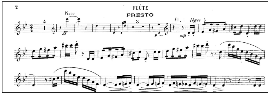
Şekil 7. Presto bölümünde pes seslerde çift dil tekniği kullanımı

Eserin ikinci bölümü olan Presto pes seslerde net ve keskin bir çift dil tekniği gerektirir. Alt sesleri net çalmak çoğu kişi için zor olabilir ancak zaten odaklanmış ve istikrarlı pes sese sahip olanlar tarafından pes sesler çift dilde rahatlıkla çalınabilir. Bu kısımda teknik olarak zor olmayan ancak tempo içinde kalarak çalmayı gerektiren arpej ve kromatik geçişler vardır (Şekil 7).