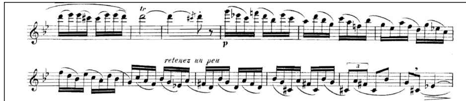
Şekil 8. Modülasyon geçişi ve senkop kullanımı

Zorlayıcı pasajlar modülasyonun ve senkop kullanımının bir arada olduğu, seri ve bol artiküle gerektiren hızlı pasajlardır (Şekil 8).