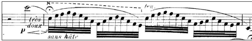
Şekil 5. Fransız müziği etkileri, pentatonik tınılar

Bu pasaj puandorg kullanımıyla icracının yorumuna bırakılmış, adlibitum 10 çalınabilen, adeta küçük bir kadans yapısındadır (Şekil 5).