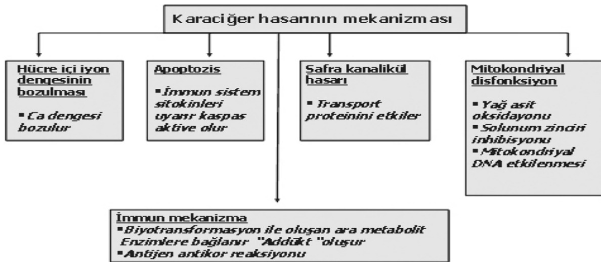
Tablo 5. Toksik hepatit mekanizması