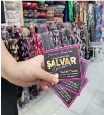
Görsel 5. Dip koçanlı bilet örneği (URL-9).