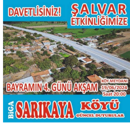
Görsel 6. Biga Sarıkaya Köyü Şalvar Etkinliği Duyuru (URL-10).