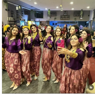
Görsel 7-8. Yaş gruplarına göre farklı şalvarlar giyen katılımcılar.