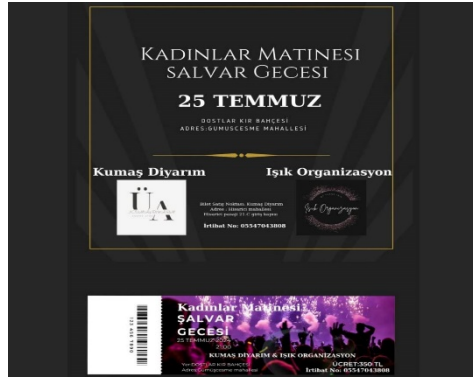
Görsel 1-2-3-4: Çeşitli Firmaların Şalvar Gecesi Duyuru Paylaşımları (URL-5; URL-6; URL-7; URL-8).