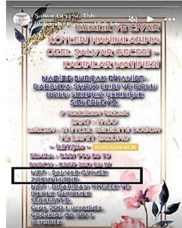
Görsel 9-10. Düzenleyicilerin şalvar giyilmesini zorunlu tuttuklarını ifade eden paylaşım örnekleri. (URL-5; URL-10).

Gecenin en önemli sembolik unsuru olan şalvarın yanında katılımcı kadınlar elbette ki seçtikleri şalvarlarla uyumlu bir üst giysisine de ihtiyaç duymaktadırlar. Bu noktada,