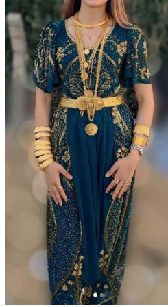
Görsel 11. Kat Urba Örneği..

bir örnek olarak giymeye karar verdikleri şalvarlarla uyumlu renklerde (çoğu kez siyah olmakla birlikte genellikle düz renkli) bir bluz veya tişört (ve giyenler için başörtüsü) ile durumu kotaran kadınlar burada da ortak hareket etmekte ve seçtikleri üst giysilerin şalvarlarının gösterişini kapatmayacak şekilde olmasına özen göstermektedirler ki buradan da anlaşılacağı üzere gecenin asıl giyim unsuru şalvardır. Buna mukabil genç kızların çoğunlukta olduğu bazı katılımcı gruplarda, nadiren de olsa, alt-üst takım şeklinde bir kombinden oluşan ve Çanakkale geleneksel kadın kıyafetleri arasında “kat urba” adıyla anılan takım giysi de tercih edilerek düzenleyicilerden talep edilmektedir.