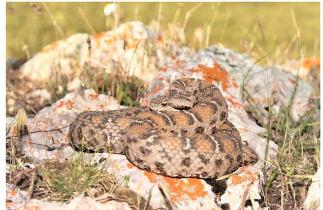
Şekil 1: Montivipera albizona (Beyaz bantlı dağ engereği)'ya ait erişkin bireyin genel görünümü

içerisinde teraryumda ölü olarak bulunan juvenil bireylerin ağırlıkları Radwag AS220.R2 marka hassas terazi ile tartılmıştır. Daha sonra ölü juvenil bireyler pens ve makas yardımıyla amnion zarının içerisinden dikkatli bir şekilde çıkarılarak ağırlıkları tekrar hassas terazide tartılmıştır. milimetrik cetvel kullanılarak da boy uzunlukları ölçülmüştür. Yapılan bu çalışma ile M. albizona türüne ait ölü doğum gözlemi ilk kez bildirilmektedir. Bununla birlikte Kian ve ark. (2011) yapmış oldukları bir çalışmada Montivipera latifi türünde 4 birey doğumu gözlemlemiş, bir bireyin sağlıklı olduğunu bildirmiştir.