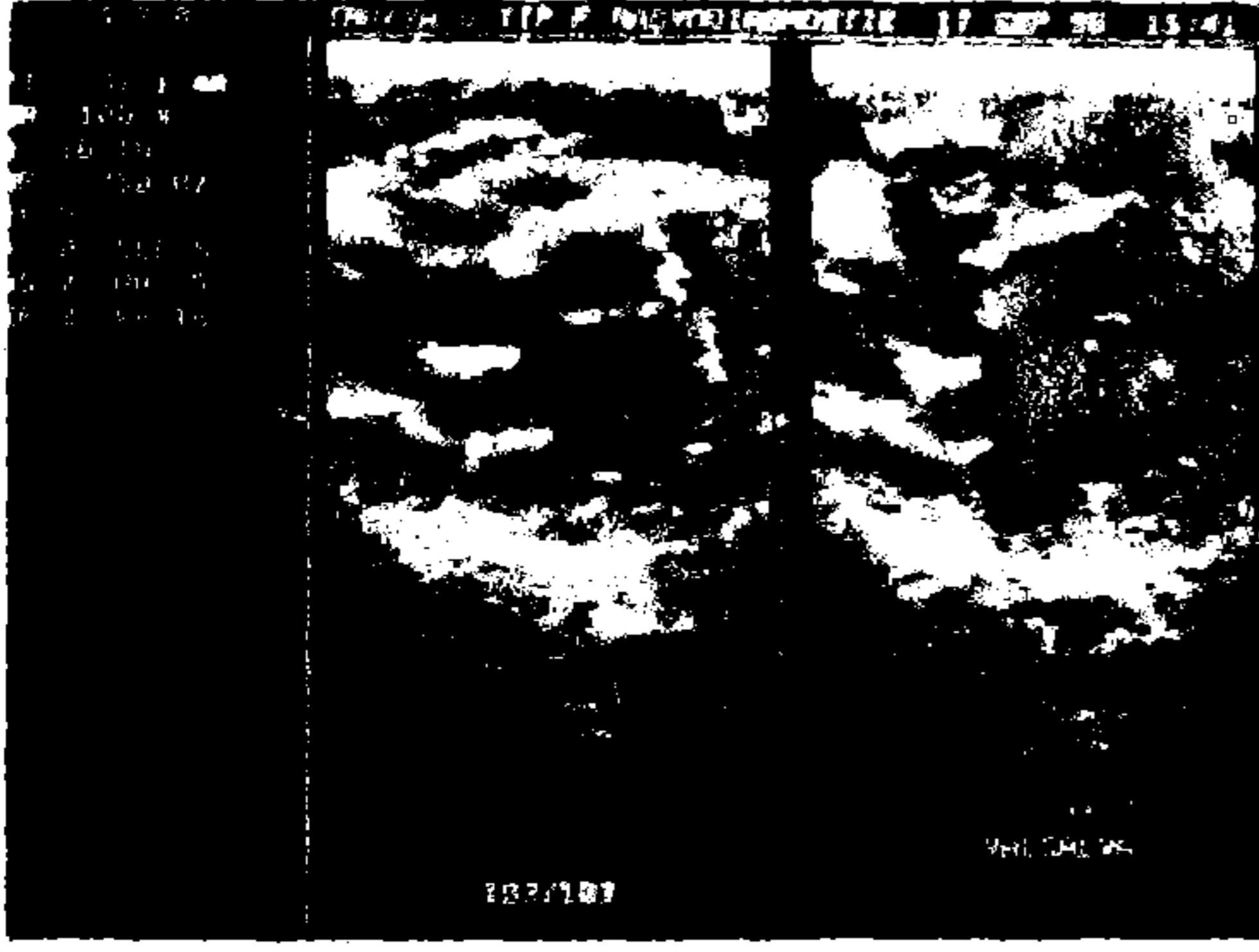
Resim 1: Grade III varikosel olgusunda renkli Doppler görüntüleme.