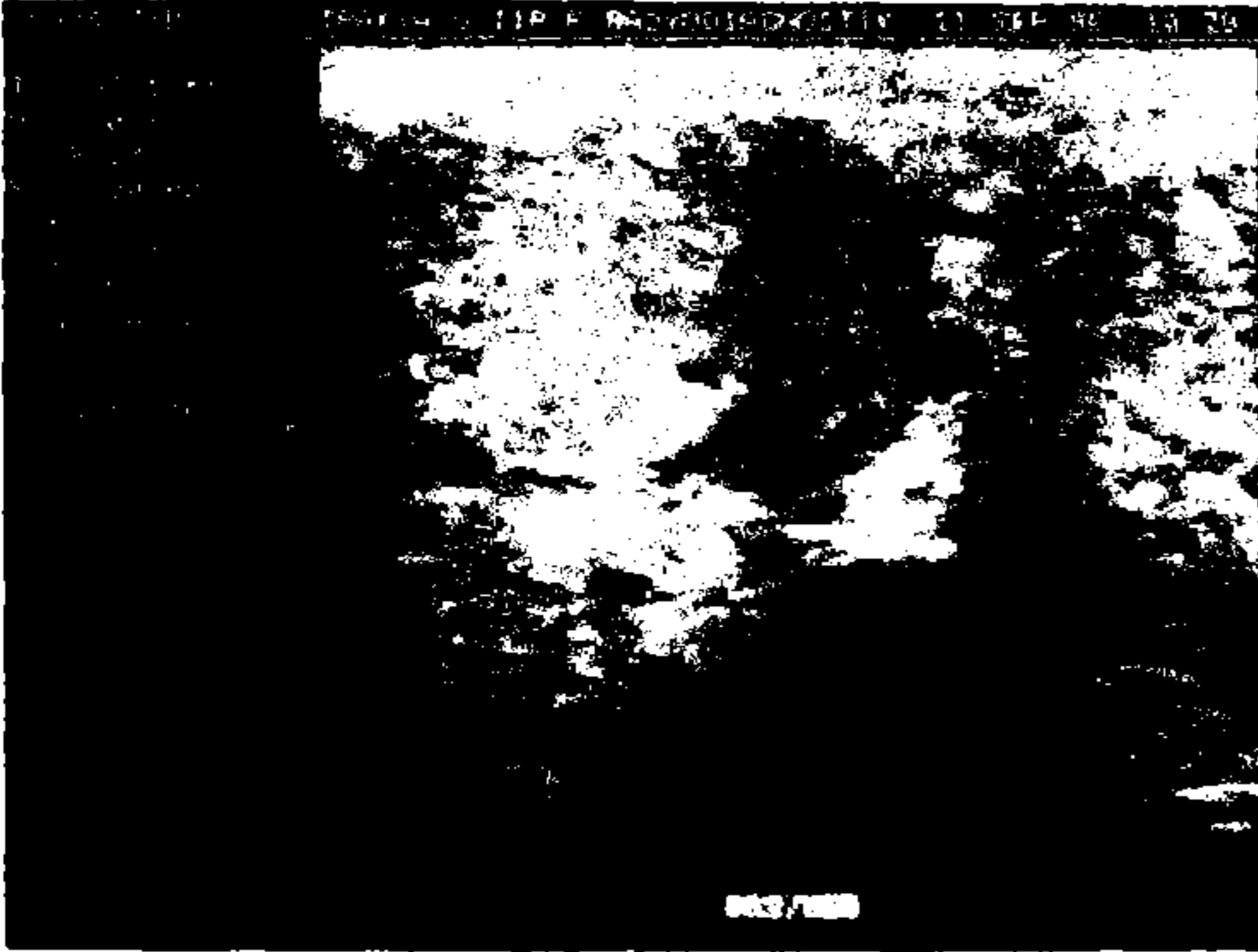
Resim 3: Subklinik varikosel olgusunda, erekte pozisyonda belirgin dilatasyon ve reflü akım.

Renkli Doppler US ve standart US bulguları karşılaştırıldığında ise, standart US sensitivitesi supin pozisyondaki incelemeye göre % 55, erekte pozisyondaki incelemeye göre ise % 44'dür. Spesifite ise her iki pozisyonda % 100 olarak bulundu.