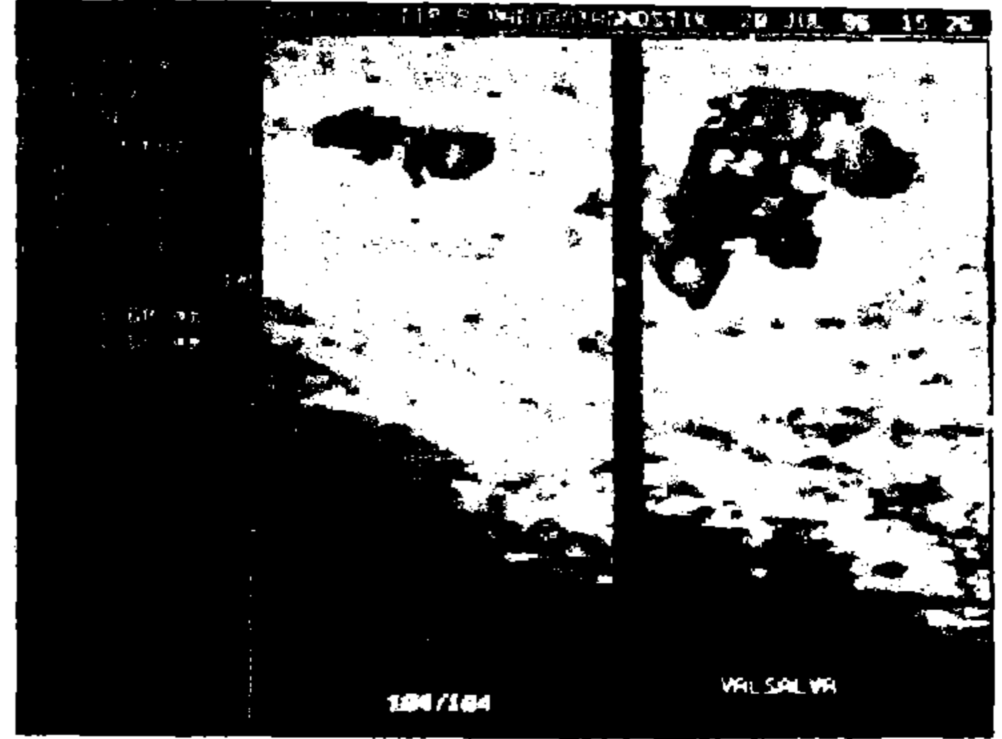
Resim 2: Subklinik varikosel olgusunda, Valsalva manevrasıyla varikoid venöz yapılarda dilatasyon ve reflü akım.