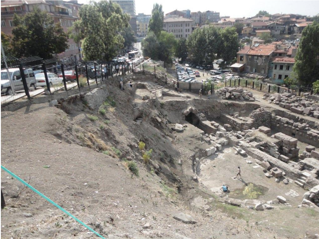
Res. 4: Tiyatro Genel Görünüm