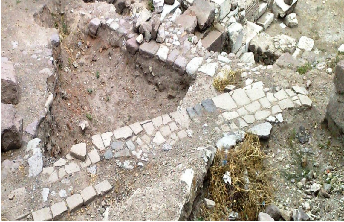
Res. 9: Anastyros