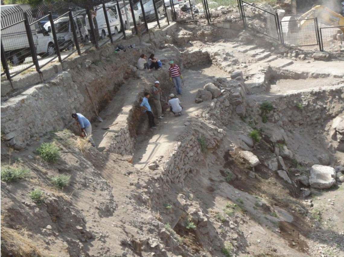
Res. 10: Kazı Çalışmalarından Bir Görünüm