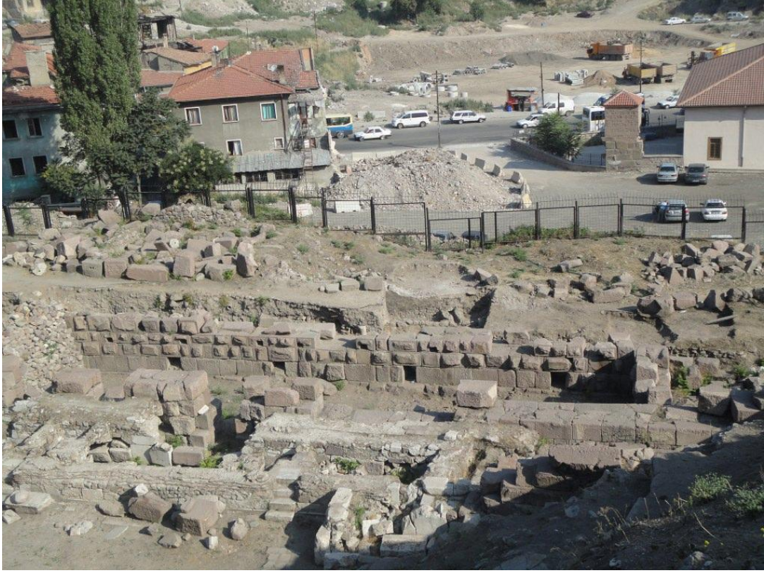
Res. 5a: Sahne Binası ve Hatları