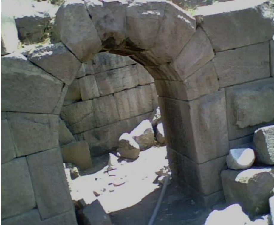
Res. 8: Eğik Tonozlu Kemerler Kapı