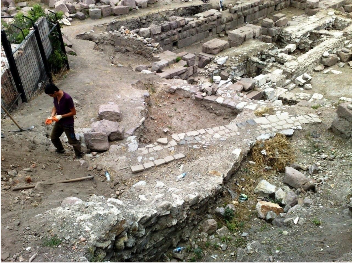
Res. 11: Temizlik Çalışmalarından Bir Görünüm