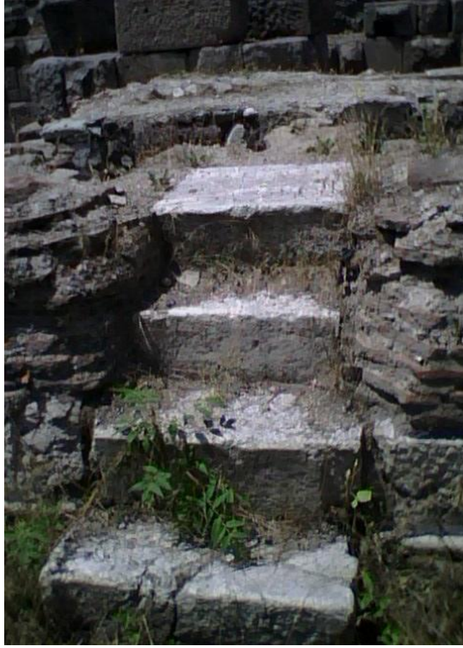
Res. 7: Dört Basamaklı Proskeneeye Çıkan Merdiven