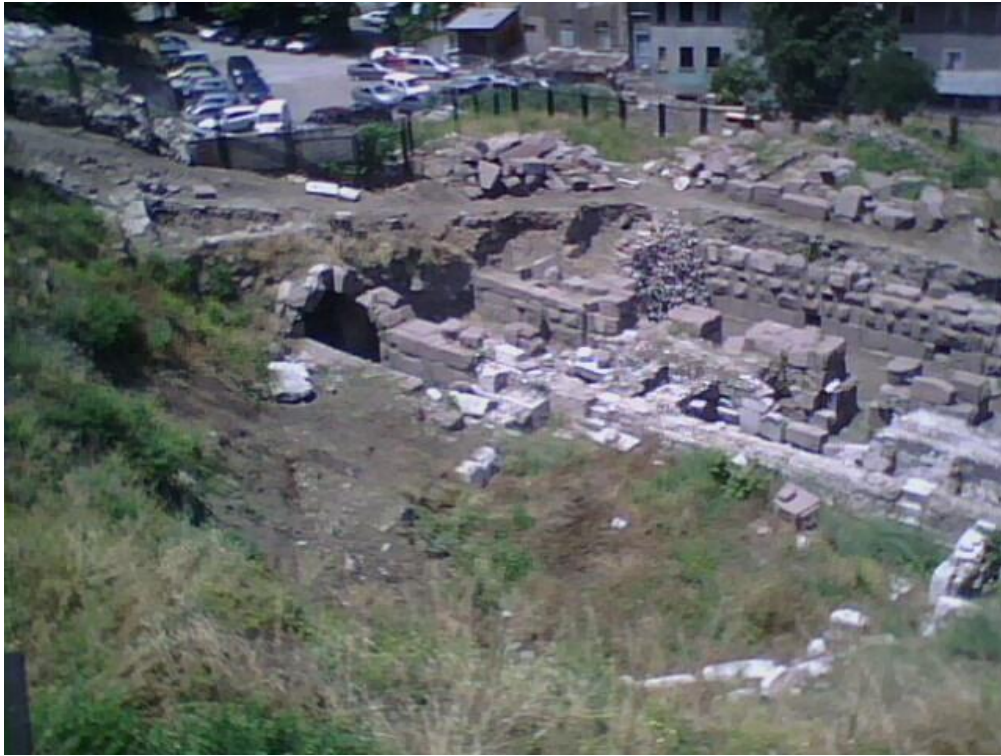
Res. 2: Temizlik Öncesi Görünüm 23