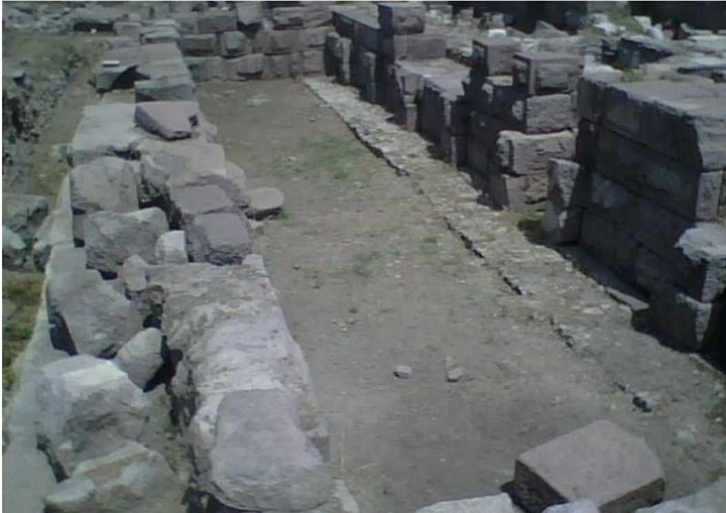
Res. 5b: Sahne Binası ve Hatları