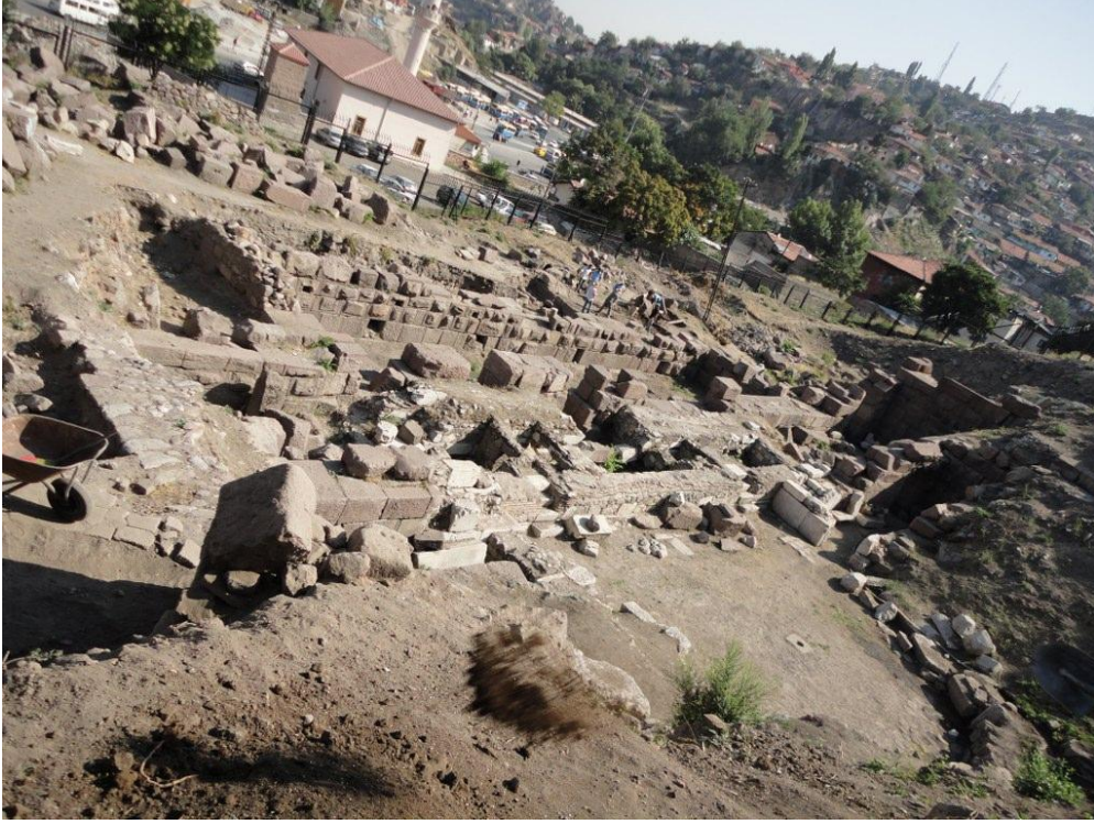
Res. 3: Temizlik Sonrası Görünüm