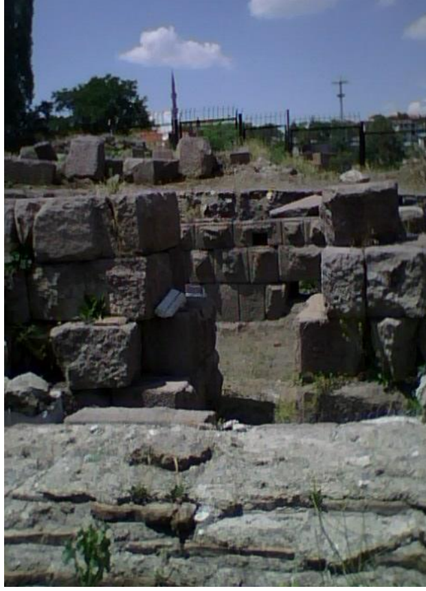
Res. 6: Sahne Binası (Skene)