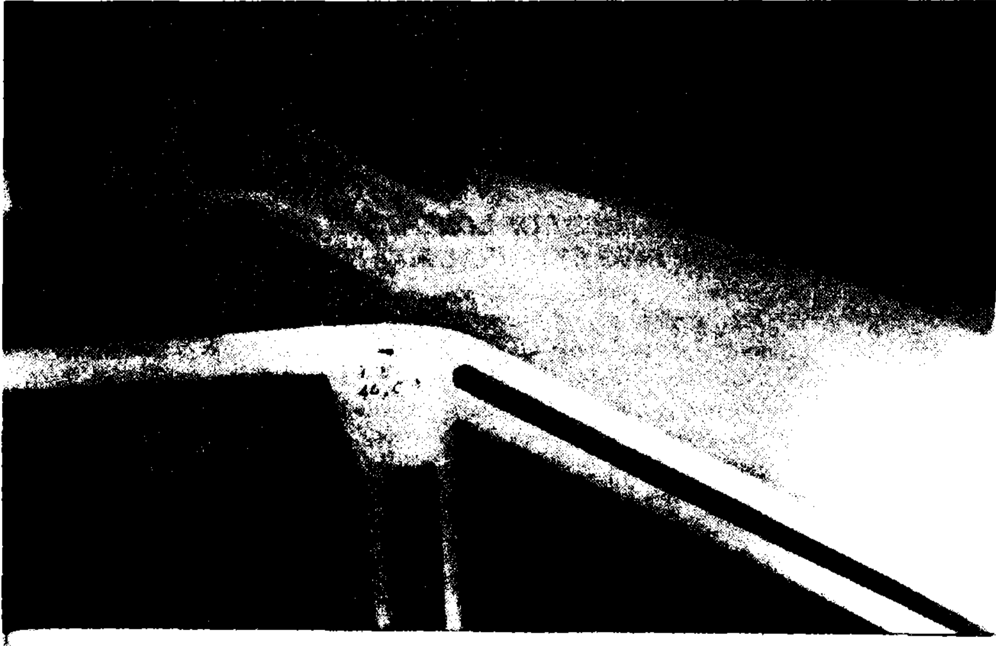
Resim1: 44 yaşında erkek hasta, ateşli silah yaralanması, grade III B açık femur kırığı. Tedavi öncesi grafisi.

Hastaların 13 tanesi erkek, 4 tanesi kadındı. Ortalama yaş 39.8( 16-67) olup müdahaleler ortalama 10.6 gün sonra gerçekleştirildi.( 2-35) Hastalar ortalama 9.2 ay takip edildiler. Kırıkların 3 'ü kapalı, 14 'ü açık kırıktı. Açık kırıkların Gustilo sınıflamasına göre; 4 'ü I. Derece, 5 'i II. derece, 2 'si III A, 2 'si IIIB, 1 'i IIIC idi. Kapalı kırıkların 2 'si femur, 1 'i tibiada idi. Açık kırıkların 12 si tibiada, 2 si ise femurda idi.