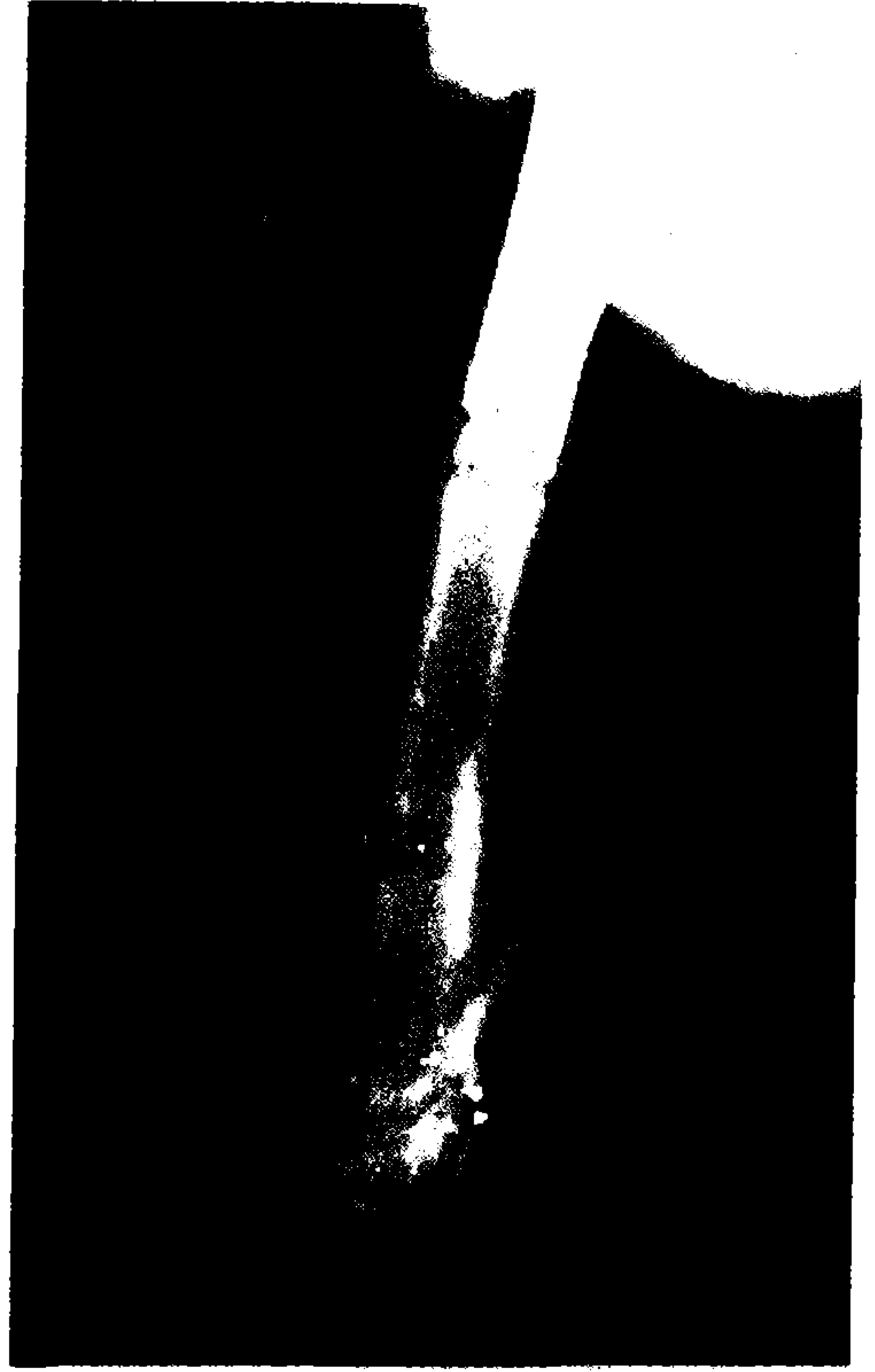
Resim 4 ve 5: Aynı hastanın ameliyat sonrası 8. aydaki iki yönlü kontrol grafileri. Sistem çıkarılmış, kemik kaynamış.

dokusunun kemikleşme yönünde gelişimine ayrıca katkıda bulunur. Bu ise, İlizarov sisteminin stabil ve rijid fiksasyon sağlayan plak-vida gibi implant sistemlerine göre kırık iyileşmesindeki üstünlüğünün önemli nedenlerinden biridir.(3-5) Serimizde de İlizarov eksternal fiksatörünün sunduğu stabil tespit sayesinde hastalarımızda erken ve desteksiz yürüme elde edilmiştir. Bu eylemin ise, tüm kırıklarda elde ettiğimiz kaynamada oldukça etkili bir faktör olduğu düşünüldü.