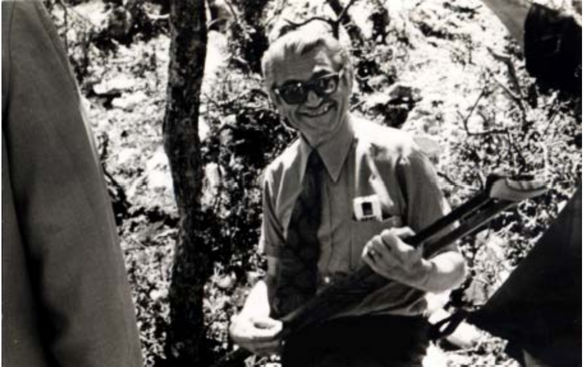
Koltuk değneği de gereğinde tellenir, söze, dile gelir sevdalısının elinde...