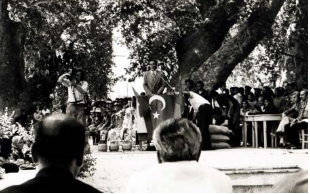
Törenin açılış konuşmalarından