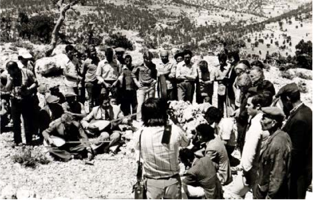
Aynı günde, şenliğe katılan âşıkların, Karacaoğlan'ın mezarı başında türküler söylediği ve sazlarını topluca mezar üzerine bıraktıkları anlaşılıyor.