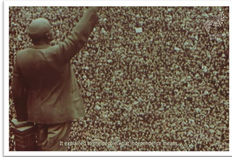
Fotoğraf 9. “Son İclas” Filminde Azerbaycanlıların Bağımsızlık Mitingi