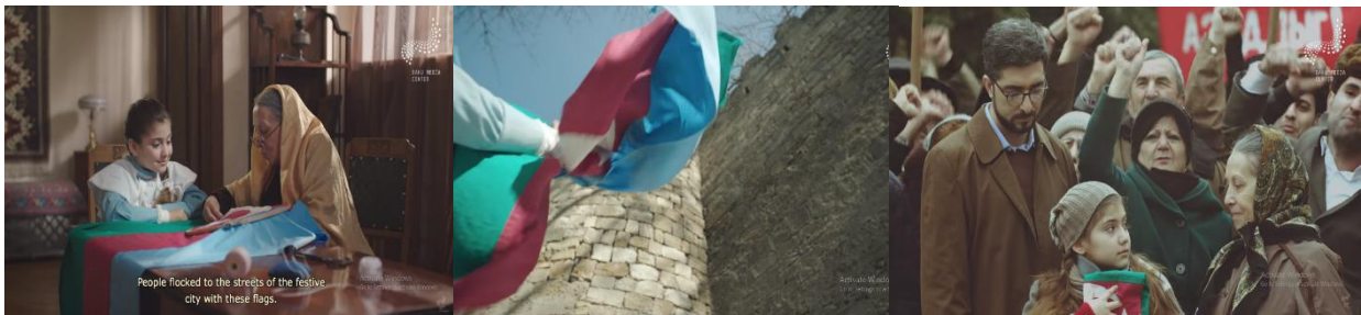
Fotoğraf 3. “Son İclas” Filminde Kollektif Bellek, Bireysel Bellek ve Hatıra Aktarımı

Filmde, Kızıl Ordu'nun Azerbaycan Halk Cumhuriyeti arazisine girişi sırasında Türk bayrakları kaldırması ve Türk şarkıları söylemesi, dönemin Bolşeviklerinin, Atatürk'ün davetiyle savaşa destek için Azerbaycan arazisinden geçecekleri iddiasını öne sürmeleriyle paralel olarak sunulmaktadır. Ancak bu iddia sadece bir bahane olarak kurgulanmıştır ve filmin ilerleyen aşamalarında, gerçek amaçlarının ülkeyi işgal etmek olduğu açıkça ortaya çıkmaktadır. Film, Azerbaycan halkının kolektif hafızasında yer eden Türk imgesini açıklarken, Kızıl Ordu'nun bu imgeyi nasıl kullanarak Azerbaycan'ı işgal ettiğini de deşifre etmektedir. Bu bağlamda film, tarihsel olayları ve kolektif hafızayı analiz ederek, olayların gerçek anlamını ve arka planını izleyiciye sunmayı amaçlamaktadır.