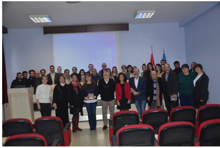
Görsel 9: Etkinlik sonu fotoğrafı