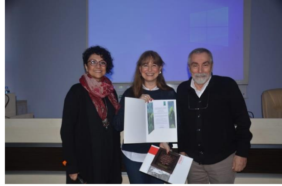
Görsel 5, 6, 7: Etkinlikten kareler