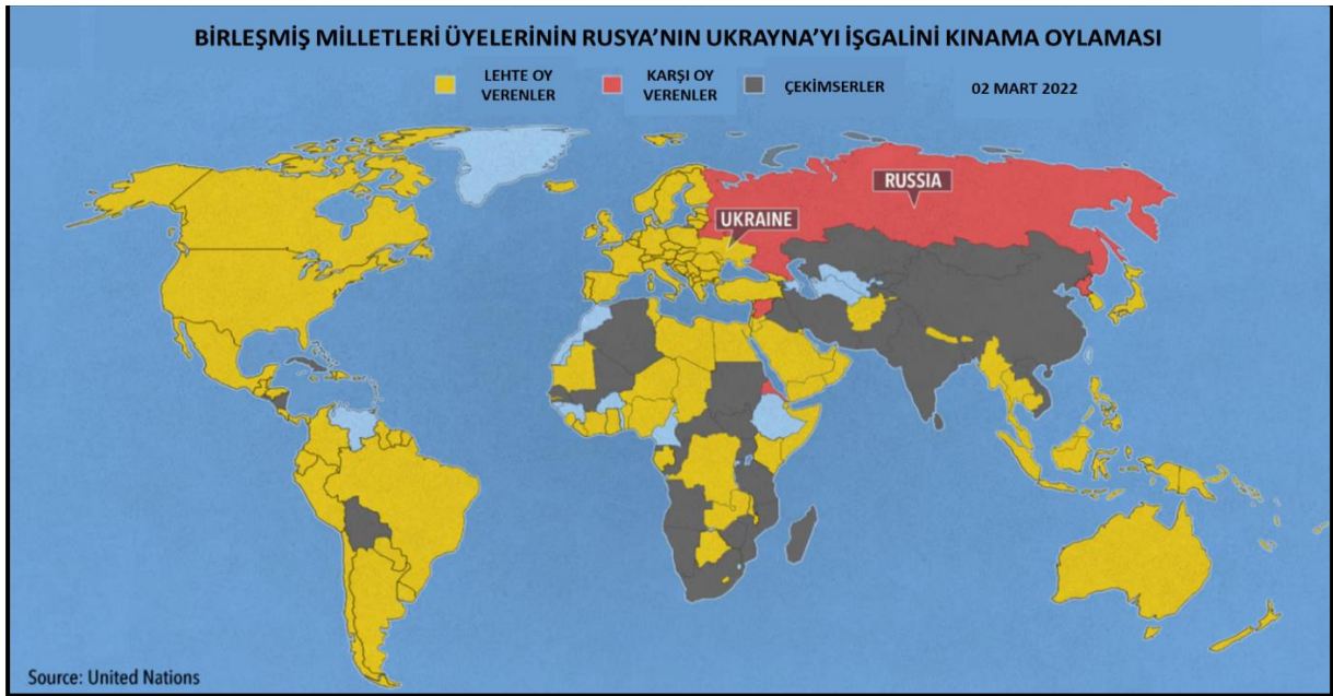
Şekil 2: Oylama Sonucu Bir Kutuplaşma Göstergesidir (news.un.org, 2022)

Günümüzde yeni bir savaş yöntemi olarak kabul görmeye başlayan hibrit savaş; düzensiz göçler ve sınır ihlalleri, etnik-mezhepsel çatışmalar, organize suç örgütlerinin küresel ağları, siber saldırılar, vekil paramiliter grupların askerî faaliyetleri, enerji arz ve sevk güvenliği, küresel terörizm, şeklinde tehdit unsurları ile kendini göstermektedir (Altıntaş, 2024, s. 116). ‘Hibrit Savaş’ klasik savaş ve gayri nizami harp teknikleri kullanılarak büyük ölçekli askerî istila yerine, saldıran tarafın yıkıcı istihbarat operasyonları, dezenformasyon ve propaganda, sabotaj girişimleri, sosyal kaos ortamı yaratmak, organize adli suçlar, ekonomik saldırılar, siber saldırılar ve vekil paramiliter unsurları desteklemek gibi çeşitli eylemler yoluyla, hedef ülkeyi zayıflatmaya çalıştığı bir dizi düşmanca faaliyeti kapsamaktadır. Sivil-asker ayrımının ortadan kalktığı, klasik savaşlara nazaran daha düşük maliyetli ve oldukça etkili olan bu yeni nesil savaş türü, saldırgan tarafın hedef ülkelerde daha yıkıcı sonuçlar elde etmesine rağmen, dünya kamuoyunun tepkisini daha az çekebilmektedir (Altıntaş, 2024, s. 116).