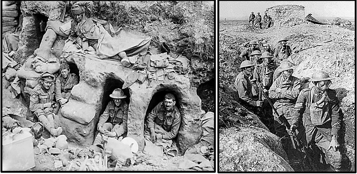
Fotoğraf 1: Birinci Dünya Savaşı'nda Kullanılan Mevziler.

Birinci Dünya Savaşı'nın hâkim strateji anlayışı taarruz olmasına rağmen muharebeler genellikle 'mevzi savaşı' esaslarına göre icra edilmiştir. Mevzi savaşı anlayışı ile tahkim edilmiş mevzilerde savunma ve bu mevzilere karşı yapılan ısrarlı taarruzlar savaşın genel karakteristiği olmuş, muharebelerde emir komuta birliği, esneklik, manevra, sıklet merkezi inisiyatif, liderlik, gibi savaş prensipleri kullanılamamıştır.