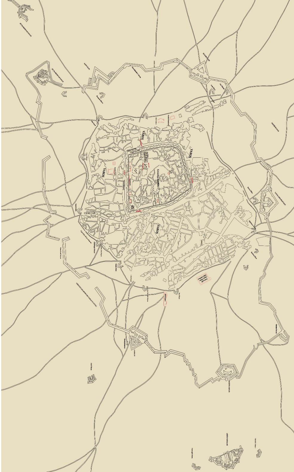
Resim 2: Surlar ve Tabyalarıyla Birlikte Erzurum Kalesi