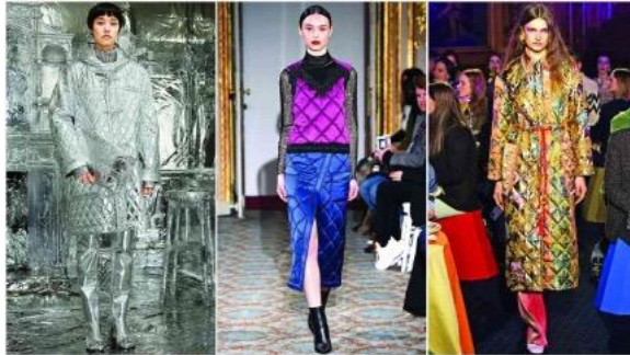
Resim 9: (soldan sağa) MM6 Maison Margiela, Huishan Zhang, Peter Pilotto, Sonbahar-Kış, 2018, Londra Moda Haftası (URL-4).

Cecilie Bahnsen 2018 yılı Sonbahar/Kış sezonuna ait tüm koleksiyon parçaları yorganlama ve geometrik kapitone tekniğiyle üretilmiştir. Tasarımlarda parlak saten kumaşlar tercih edildiği görülmektedir. Tasarımlarda renk olarak ise pastel tonlarda kullanılan pembe ve kırık beyaz gibi renklerin kullanımı ve tekniğin kullanımında oluşturulan desenler izleyici üzerinde estetik bir etki bırakmaktadır. Teknik, rölyef etkisiyle kumaş üzerinde belirginlik oluşturarak tasarımın dokusal etkisini ön plana çıkartmaktadır (Bk. Resim 10).