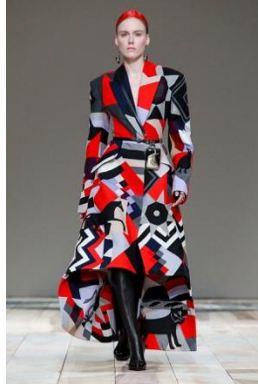
Resim 13: Alexander McQueen Sonbahar/Kış 2020, Kadın Koleksiyonu (URL-8).

Teknik, tasarımlara hem nostaljik hem de estetik bir görünüm kazandırmaktadır. Özellikle 1960'lı yıllarda kullanılan "hippie" modasından esinlenen ve "vintage" bir tarz sunan teknik, geçmişten gelen dokunuşlarla günümüz modasında kendine yer bulmaktadır. Bu teknikle tasarlanan kıyafetler, bir ifade biçimi olarak bireyselliği ve farklılığı öne çıkaran tasarımlar sunmaktadır. Teknik, günlük giyimden özel etkinliklerde kullanılan parçalara kadar geniş bir kullanım alanına sahiptir.