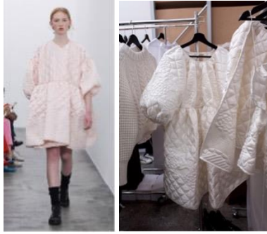
Resim 10: Cecilie Bahnsen, Sonbahar/Kış , 2018, Kopenhag (URL-5).

Yorganlama tekniğiyle oluşturulan kıyafetler, kabarık ve dolgun bir yüzey yapısına sahiptir. Bu özellik, kıyafetlere hacimli bir görünüm kazandırırken aynı zamanda vücudu sıcak tutma işlevi de sağlamaktadır. Dolgu malzemesi sayesinde, bu teknikle üretilen kıyafetler iyi bir yalıtım özelliği sunmaktadır. Genellikle dolgu malzemesi olarak yapay elyaf tercih edildiğinden, kıyafetler hafif ve esnek bir yapıya sahip olmaktadır. Bu durum, giyen kişiye hareket özgürlüğü tanımakta ve tasarımlara işlevsellik kazandırmaktadır. Bu teknikle üretilen kıyafetlerin yüzeyindeki desenler, kıyafetlere görsel bir çekicilik katmaktadır. Bu desenler, genellikle kapitone örneklerinde olduğu gibi geometrik şekiller, çiçek motifleri ya da düz boyuna çizgiler şeklinde çeşitlilik göstermektedir. Bu teknik, yalnızca tasarımın görselliğini artırmakla kalmayıp farklı stil ve giyim parçalarında da uygulanabilmektedir. Ceketler, montlar, elbiseler, etekler ve hatta ayakkabılar gibi geniş bir ürün yelpazesinde kullanılmaktadır. Bu teknikle üretilen kıyafetler, kullanıcılarda şık görünmesinin yanı sıra sıcaklık ve konfor sunmaktadır.