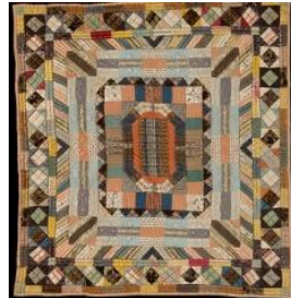
Resim 5: Kırkyama Yatak Örtüsü Örneği, 1690 - 1720, Kent, İngiltere (URL-3).