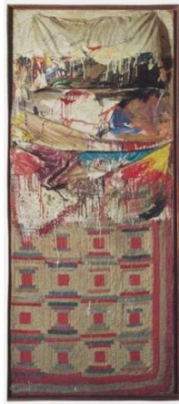
Resim 7: "Bed" Robert Rauschenberg, 1955 (Rauschenberg, 1976).

19. yüzyılın sonlarından itibaren düşük sanatlar olarak kabul edilen bazı el işi teknikleri, Arts and Crafts Hareketi ile el işçiliğini yeniden canlandırılmış ve bu sayede 20. yüzyılda tekrar sanat olarak tanımlanmaya başlamıştır. 1955 yılında Robert Rauschenberg tarafından yapılan "Bed" (Bk. Resim 7) adlı çalışmasıyla birlikte, yorgan tarihinde ilk kez bir çağdaş sanat eseri olarak ele alınmıştır. Geleneksel tekstil ve zanaat teknikleri, 1960'lı yıllardan itibaren çağdaş sanatçıların daha fazla ilgisini çekmiştir. Yorgan sanatı teknikleri geliştirilerek, çok çeşitli tekstil sanat alanında kullanılmıştır. Yüzyılın sonuna gelindiğinde, Tracey Emin ve Michelle Walker, Zak Foster gibi sanatçılar tarafından kullanılan bu teknikler, çağdaş sanat alanında yorgan sanatını önemli bir konuma getirmiştir (URL-1). Günümüzde, tekstil malzemeleri kullanarak çalışmalar yapan tekstil sanatçıların yanı sıra, farklı alanlardan sanatçıların da olduğu bilinmektedir. Ayrıca bu uygulama 1960'lı yıllarda moda endüstrisi tarafından "hippie" kültürü ile ilişkilendirilen bir moda tarafından benimsenmiştir. Çağdaş yorgan sanatı tekniklerini kullanan moda tasarımcıları, işleme, baskı, boyama, yorganlama, kırkyama, applike gibi teknikleri bir arada kullanarak tasarımlar gerçekleştirmektedir.