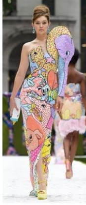
Resim 15: Moschino, İlkbahar/Yaz, 2022 (URL-10).

Benzer bir şekilde, Leutton Postle'in 2012 Sonbahar/Kış koleksiyonunda teknik tamamen sanatsal bir ifade aracı olarak ele almıştır. Parlak yüzeylerin ve pastel tonların bir arada kullanıldığı bu koleksiyon, mozaik benzeri bir görünüm sunmaktadır. Katmanlı kumaş parçalarının farklı renk ve dokularla birleştirilmesi, giysilere hareketlilik kazandırmıştır. Her iki markaya ait tasarımlarda dolgu malzemesi aracılığıyla yüzeyde oluşturulan aplike ile desenlere rölyef etkisi vermiştir. Moschino'nun tasarıma enerjik yaklaşımı ile Leutton Postle'in sofistike yorumu, geleneksel teknikleri modern bir perspektifle yeniden yorumlamış ve çağdaş moda anlayışına önemli katkıda bulunmuştur.