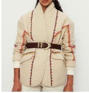
Resim 8: Ba&sh, Sonbahar/Kış 2023 (URL-4).

MM6 Maison Margiela, Huishan Zhang ve Peter Pilotto'nun 2018 yılı Sonbahar/Kış sezonuna ait yorganlama tekniğiyle üretilen dış giyim örnekleri incelendiğinde, tasarımların canlı ve parlak kumaş renkleriyle, dikkat çeken formlarının ön planda olduğu görülmektedir. Bununla birlikte, tasarımlardaki geometrik şekiller, kare motifler ve paralel dikişlerle oluşturulan kapitone dikiş, yüzeyde üç boyutlu bir etki ve dokusal bir görünüm yaratmıştır. Uygulanan teknik, tasarımların güçlü bir etki yaratmasına, izleyicinin dikkatini çekmesine ve tasarımların daha vurucu bir şekilde öne çıkmasına katkı sağlamaktadır. Dokusal ve görsel zenginlik, tasarımların çağdaş ve yenilikçi bir anlayışla yorumlanmasını mümkün kılmıştır (Bk. Resim 9).