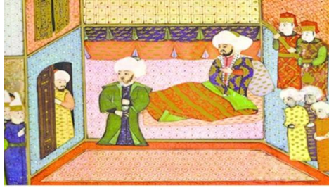
Resim 2: Nakkaş Osman'ın (16. yy) "Hünername'de Yer Alan Bir Minyatür (Duman, 2007).

kalın dokumaların yanı sıra ince kumaşlar ve örgü üretiminde kullanılmaktadır. Yorgan yapımında kullanılan yün ise yıkanmış ve tiftiklenmiş ham yündür. Yorgan yapımı, Türk geleneksel tekstil sanatının bir parçası olmuş ve uzun yıllar boyunca gelişmiştir. Türklerde yorgan sanatının gelişimi, yerleşik hayata geçiş dönemlerine denk gelmekte olup, geleneksel süsleme sanatları arasında uzun bir gelişme süreci yaşamıştır. Yerleşik yaşamın başlamasıyla tarım faaliyetleri gelişmiş ve bu süreçte pamuk yetiştiriciliği de başlamıştır. Bu süreçte dokuma sanatı ilerleyerek üretimde büyük ölçüde pamuk kullanılmaya başlanmıştır (Yardımcı, 2008). Özellikle Selçuklu ve Osmanlı dönemlerinde, yorgancılık mesleği önemli bir yere sahip olmuş ve üretim teknikleri büyük ölçüde geliştirilmiştir. Zamanla yapım yöntemleri gelişmiş, farklı desenler ve motifler kullanılmaya başlanmıştır. Doğadan elde edilen çeşitli boylarla kumaşlar boyanmış, bu sayede yorganlar süsleme açısından çeşitlendirilmiş ve daha zengin bir görünüm elde edilmiştir (Yardımcı, 2008). Kumaş yüzeyi genellikle motiflerle süslenir ve farklı iğnelerle işlenmektedir.