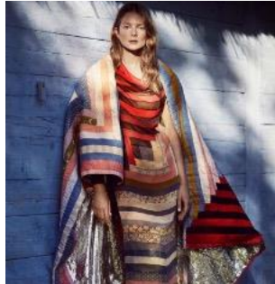
Resim 12: Calvin Klein, Sonbahar/Kış, 2018 (URL-7)

İngiliz Alexander McQueen markasının 2020 yılı Sonbahar/Kış Kadın koleksiyonu incelendiğinde, kırkyama tekniğiyle tasarlanmış görsel açıdan dikkat çekici parçalar olduğu görülmektedir. Tasarımlar, izleyiciye farklı renk ve formlardaki parçaların bir araya gelerek bir bütünlük oluşturduğu bir kompozisyon sunmaktadır. Bu parçalar geleneksel kırkyama teknikleriyle birleştirilmek yerine, dijital olarak birleştirilen ve bu şekilde üretilmiş kumaşların kullanılmasıyla tasarlanmıştır. Bu yaklaşım, tasarımlarda hem geleneksel el işçiliğini anımsatan nostaljik bir tarz yaratmış hem de çağdaş bir estetik sunmuştur. Geometrik desenlerin güçlü kontrastlarla birleştirilmesi ve düzenlenişindeki modern dokunuş, tasarımlara dinamik bir hareketlilik kazandırmıştır. Ayrıca farklı ölçeklerde ve yönlerde kullanılan formlar, tasarımlara üç boyutlu bir algı katarak izleyicinin görsel algısını zenginleştirmiştir. Yaratılan bu dijital etki, geleneksel kırkyama mirasına gönderme yaparken, modern teknoloji ve tasarımın birleştiği noktada güçlü bir moda ifadesi sunmaktadır.