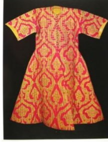
Resim 4: Yorganlama Tekniğiyle Oluşturulmuş bir Osmanlı Sultan Kaftanı, Topkapı Sarayı Müzesi (URL-2).

geçmişe sahiptir. 18. yüzyılda Avrupa'da oldukça yaygınlaşan bu yaklaşım, 21. yüzyıl moda tasarımcılarına da ilham kaynağı olmuştur. Günümüzde söz konusu teknik, birçok sanatçı ve tasarımcı tarafından kullanılmakta ve farklı yorumlarla uygulanmaktadır. Bu yöntem geleneksel ile modern arasında bir köprü kurarak tasarım dünyasında çok yönlü bir ifade biçimi sunmaktadır.