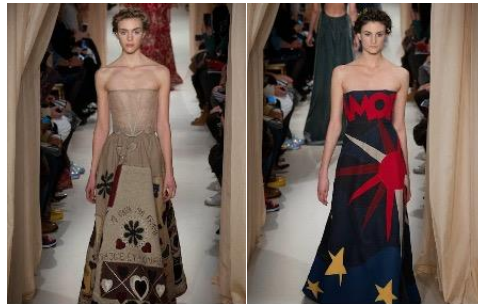
Resim 14: Valentino, İlkbahar/Yaz, 2015 (URL-9).

Moschino markasına ait 2022 yılı İlkbahar/Yaz koleksiyonunda aplike tekniğiyle üretilmiş tasarımlarda (Bk. Resim. 15) farklı desen ve renkteki formların kumaş yüzeyinin farklı yerlerine yerleştirilerek farklı desenler oluşturması planlandığı görülmektedir. Yüzeylerin dolgu malzemesiyle desteklenmesi, kıyafetlerde rölyef etkisi yaratmıştır.