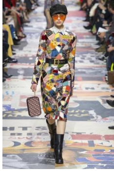
Resim 11: Dior, Sonbahar/Kış 2018 (URL-6).

dört bir yanında çizgisel formların tekrar ettiği, bu tekrarların ise tasarıma ritmik bir denge kazandırdığı görülmektedir. Tasarımda merkezde yer alan geleneksel "Madalyon stili" yaklaşımı yeniden yorumlanmıştır. Bu güncel uyarılama, hem geleneksel kırkyama mirasına bir gönderme yapmakta hem de çağdaş bir bakış açısı sunmaktadır. Tasarım, farklı renk kullanımları ve çizgi kalınlıklarıyla desteklenmiş, bu unsurlar izleyicinin görsel algısında bir bütünlük yaratmıştır. Çizgi ve renk arasındaki kontrast, tasarımı hem dinamik hem de görsel olarak çarpıcı bir hale getirmiştir.