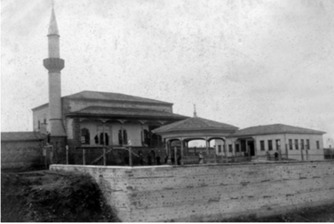
Ek-3: Suheyb-i Rumi Külliyesi'nin 1910'lu yıllardan bir görünümü