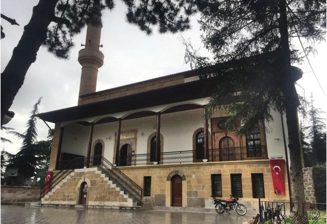
Ek-4: Cami ve türbenin gündüzündeki hali