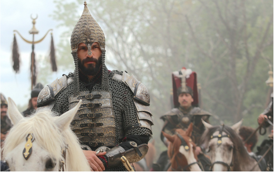
Görsel 1. Mehmed: Fetihler Sultanı, 2024

TRT Akademi Dergisi: Türkiye’de yayıncılık anlamında öncü bir kurum olan TRT, 2023 yılında uluslararası dijital platformu “tabii”yi hayata geçirdi. Zengin ve özgün içerikleriyle “tabii” 1 yıl gibi kısa bir sürede 6 milyona yaklaşan bir abone sayısına ulaştı. Bu başarının arka planında yatan etkenler nelerdir?