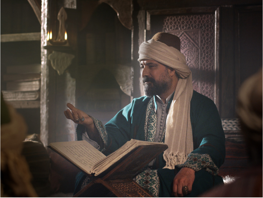
Görsel 3. Mevlânâ Celâleddîn-i Rûmî, tabii