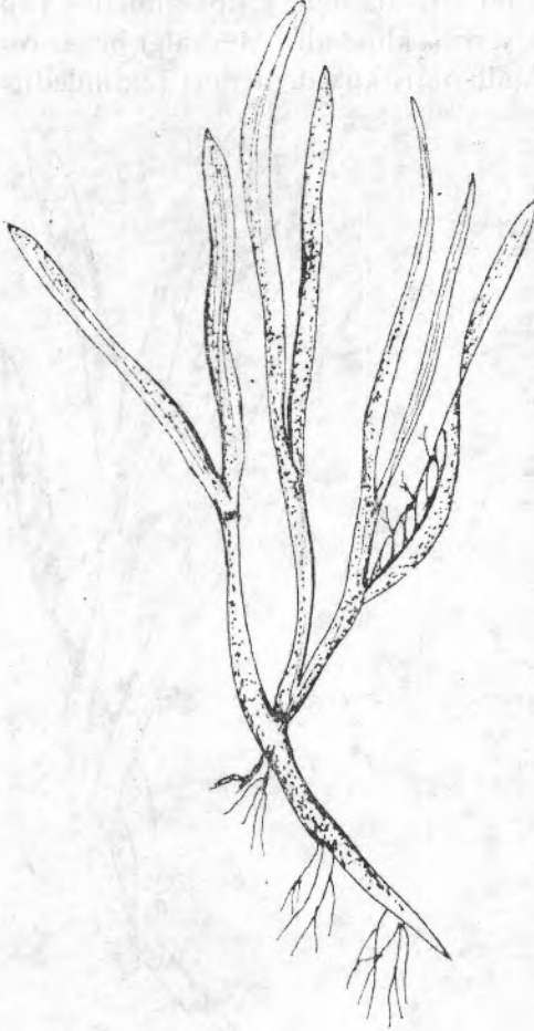
Şekil 2 : Zostera nana Roth.

Bitki 10-30 cm uzunlukta olup yapraklar ortadan kesilmiş gibidir (3).