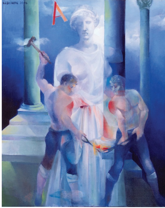
Görsel 3: Olimpos Nalbantları, 2006, 99,5 X 79,5 cm TÜYB

Bu tanımlamadan yola çıkarak efsanedeki, algılama gücü ve mantık yürütme yetisi yüksek kişileri belirleyen bir simge olarak kullanıldığını düşünebiliriz. Yunan alfabesinin ilk harfi olan alfa İbrani ve Arap alfabelerinde olduğu gibi her şeyin başlangıcı ve sayısal değeri ‘bir’ olarak bilinmektedir. İkonolojide sözel imgeler zihin, algı ve hafıza için açıklayıcı bir rol üstlenirler dolayısı ile sanatçının bu harfi tesadüfen değil bilerek esere yerleştirdiğini söyleyebiliriz. Resimde kullanılan yazı formu anlatının sözel metaforu ve aynı zamanda görsel imgeler ile harfler arasında bağ kurarak mitolojik anlatı öğelerine işaret etmektedir.