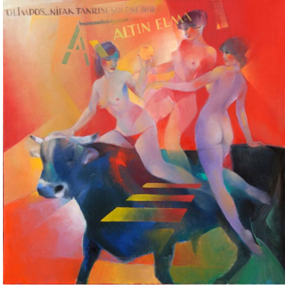
Görsel 6: Altın Elma, 2006, 100 cm x 100 cm. TÜYB.