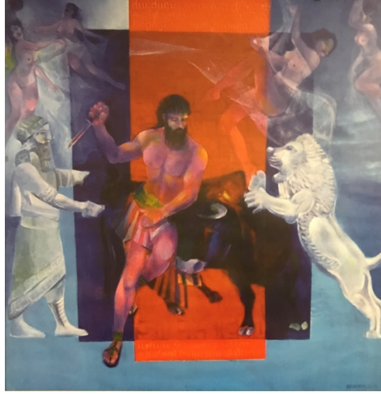
Görsel 1: Gılgamış Destanı, 2002, 150x150cm., TÜAB