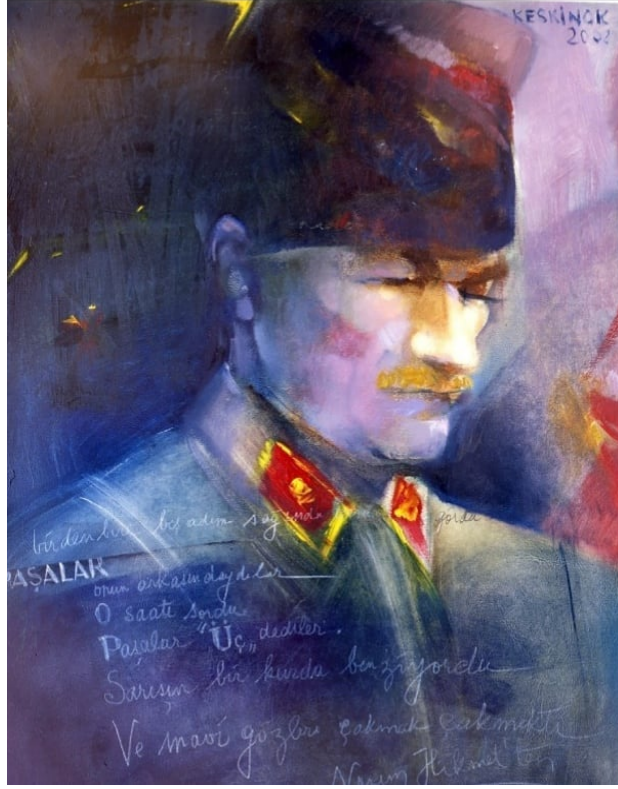
Görsel 10: Sarışın Bir Kurda Benziyordu, 2002, 70x54 cm. DKÜYB