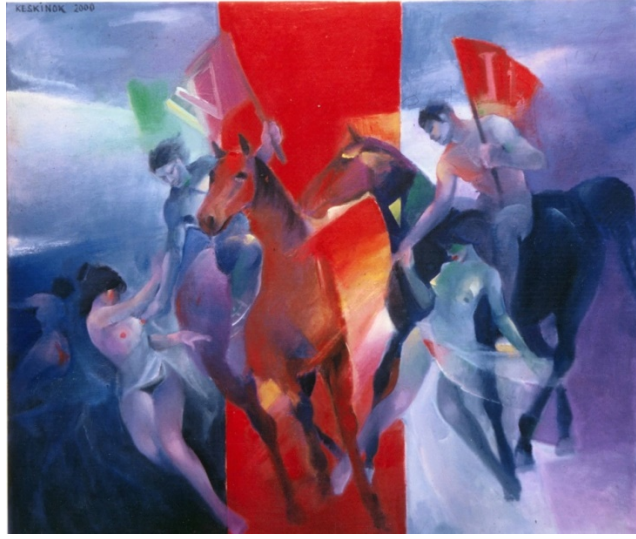
Görsel 7: Sabınlerin Kaçırılışı, 2000, 70 cm x 80 cm., TÜYB