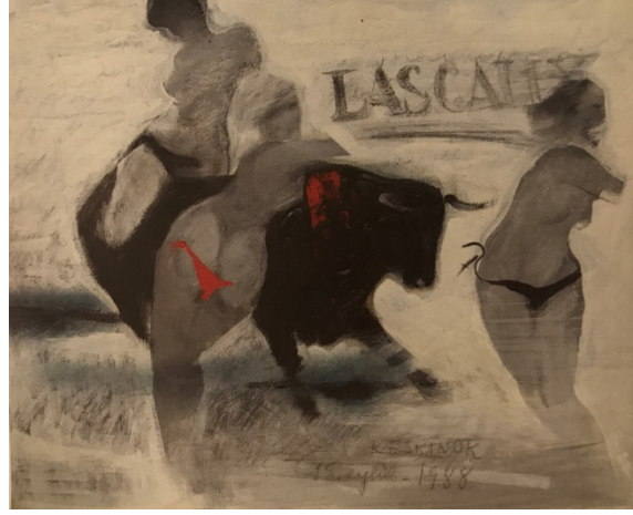
Görsel 4: Boğa Ve Kadın,1988, 90x110cm., TÜAB Görsel 5: Boğa Ve Kadın,1988, 40x50cm., TÜYB