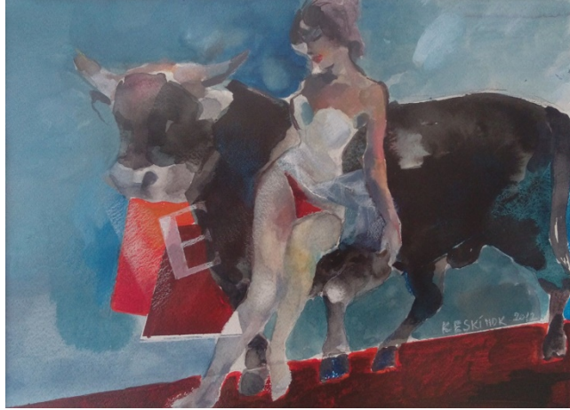
Görsel 2: Europa, 2012, 50X35 cm. KÜKT