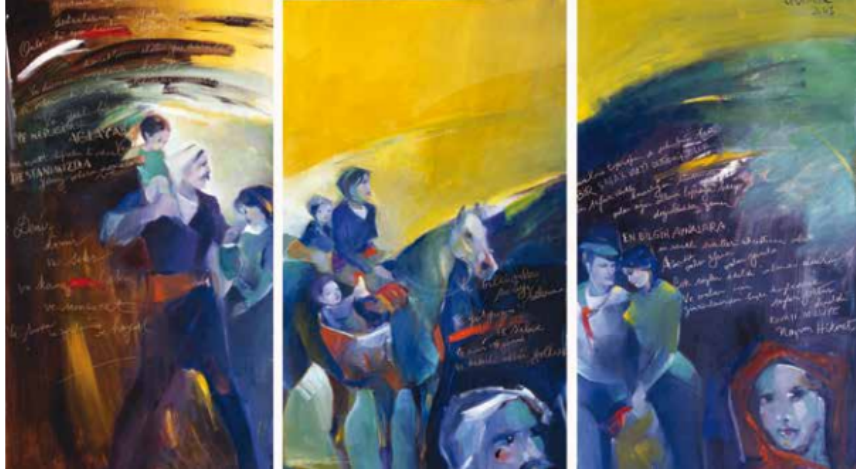
Görsel 9: Kuvayı Milliye, 2002, Üçlü 3x 142x70 cm. DKÜYB

Üçüncü panelin sol alt kenarında denizci giysisi ve beresi içinde bir erkek ile yanında modern giysili bir kadın figürü görülüyor. Panelin sağ alt köşesinde kırmızı başörtülü kadın portresine yer verilmiştir. Panelin ger planı ya da zemini soyut bir doğa parçası sarı, yeşil, mavi, siyah tonlarında boyanmış. Her üç panelde destandan alıntılanmış yazı-metinler kompozisyonu bütünleyici, estetik bir anlayışla yerleştirilmiş (Görsel 9).