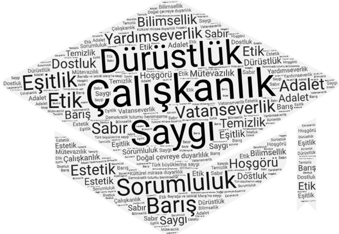
Şekil 2. Sosyal Bilgiler Öğretim Programlarında Değerlerle İlgili Kelime Bulutu

Sosyal bilgiler öğretim programında değerler ile ilgili kavramların bir araya getirilmesi ve kullanım sıklıklarının bilinmesi söz konusu ilişkinin tanımlanması adına önemli bir dönüt sağlayacaktır.