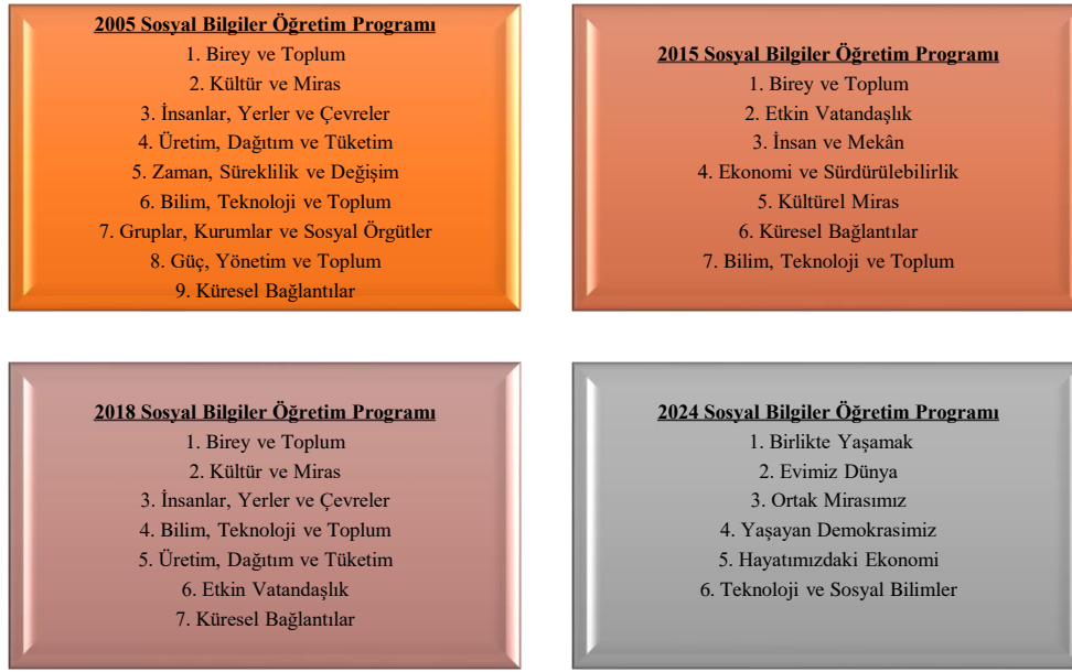
Şekil 1. Sosyal Bilgiler Dersi Öğretim Programlarında Öğrenme Alanları

Sosyal bilgiler öğretim programlarına ait değer ve kazanımlar incelenmeden önce programlarda yer alan öğrenme alanlarının bilinmesi önem arz etmektedir. Buna göre aşağıda yer alan grafik 2005, 2015, 2018 ve 2024 sosyal bilgiler öğretim programlarına ait öğrenme alanları başlıklar halinde düzenlenmiştir.