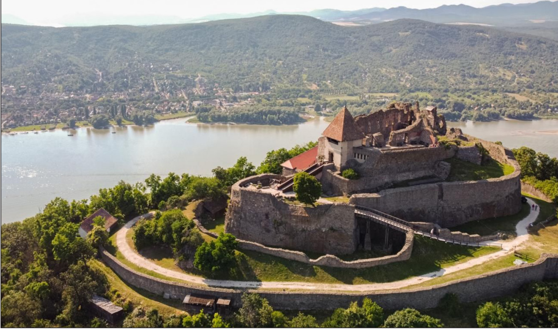
Resim 2: Visegrád Kalesi

https://www.visegrad.hu/galeriak/fellegvar (27.09.2024)