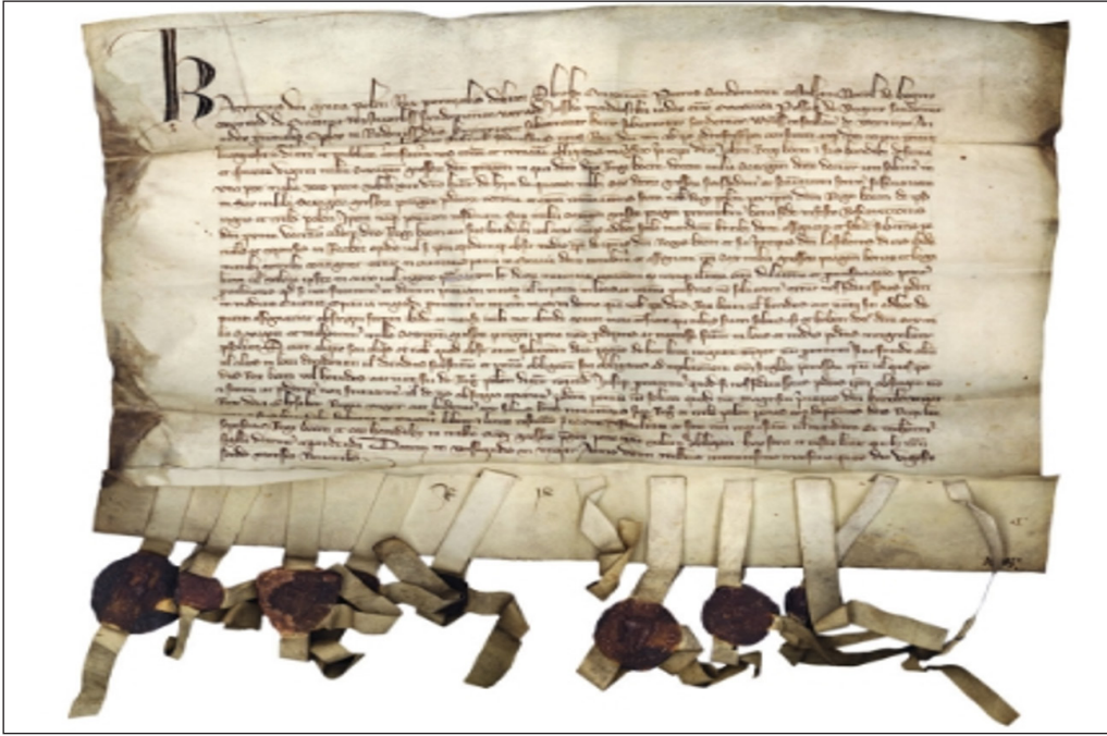
Resim 6: 19 Kasım 1335 tarihli Bohemya-Lehistan antlaşmasının belgesi

https://www.visegradgroup.eu/visegrad-1335/congress-of-visegrad (17.09.2024)