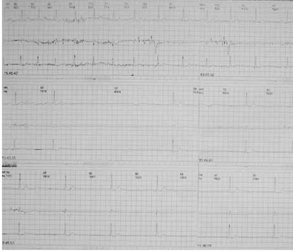
Şekil 1. Hastanın ağrı atağı anında (saat 19.45) holter EKG kaydı.

nörolojik muayene normal sınırlardaydı. Rutin kan tetkikleri, beyin BT, beyin MR, MR angio, EEG ve EKG'de özellik saptanmadı. Karotis vertebral doppler incelemesinde vertebral arter kan akımı toplam 130 ml/dk olarak hesaplandı. KBB muayenesi ve stilohyoid ligamenti gösteren servikal BT tetkiki normal bulundu. Tansiyon arteryel 150/90 mm/Hg olarak ölçülen hasta kardiyoloji hekimine senkop etyolojisi açısından konsülte edildi. Holter incelemesi yapılan hastada