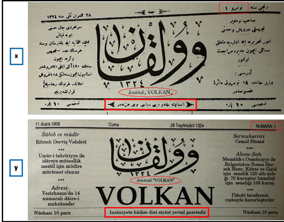
Resim 1. Volkan Gazetesinin 11 Aralık 1908 Tarihli İlk Sayısının (Numara 1) Başlığı 44

İstibdat karşıtı bir yayın olarak ortaya çıkan Volkan gazetesi, Meşrutiyet'ten 31 Mart Olayı'na uzanan süreç içerisinde tartışmalı bir role sahip olmuştur. Meşrutiyetçi çizginin giderek anti dini bir çerçeveye oturmasına sert eleştiriler yönelten Volkan, Bediüzzaman Said-i Kürdi'nin din-Meşrutiyet uzlaşısına dayalı meşrutiyet-i meşrua 45 teorisine yakın bir yayın politikası izlemiştir. Buna rağmen gazete Bediüzzaman Said-i Kürdi'nin başlarda pek ilgisini çekmemiştir. Bediüzzaman Said-i Kürdi ismine ilk olarak Volkan gazetesinin 9 Mart 1909 tarihli 68. sayısında rastlıyoruz. Bu isim Volkan gazetesinde kısa bir bilgilendirme notuyla şu ifadelerle yer almaktadır 46 ; “Kürd ulemâsından meşhur Bedüzzaman Molla Said-i Kürdî İbni Mîrza hazretleri bu cemiyette bulunmakla mübâhidir.” 47