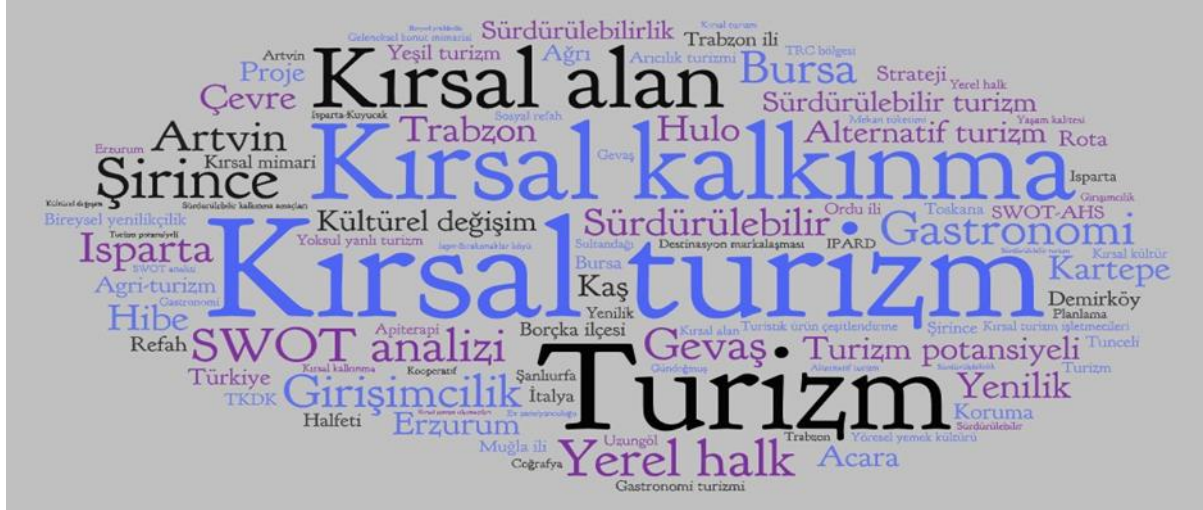
Şekil 1. Tezlerde En Çok Kullanılan Anahtar Kelimeler

Tablo 8 ve Şekil 1’de tezlerde kullanılan anahtar kelimelerden en çok kullanılan ilk beş kelime; kırsal turizm 63 kez, kırsal kalkınma 19 kez, turizm 16 kez, kırsal alan 6 kez ve SWOT analizidir. En fazla tekrar eden anahtar kelime bulutu şekil 1’de gösterilmektedir.