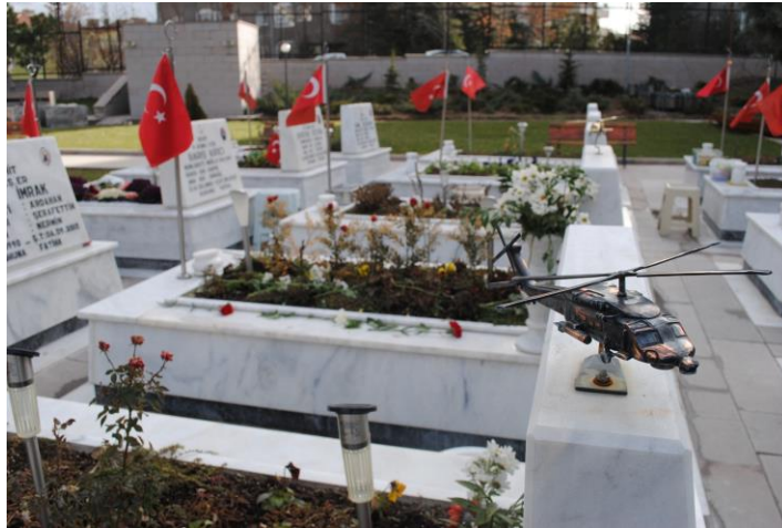
Fotoğraf 8: Mezar taşı üzerine yapılan helikopter maketi (Ocak 2013).

Mezar taşlarındaki temsiliyetlerin zamana bağlı olarak değişimi yalnızca sözler aracılığıyla gerçekleşmemektedir. Özellikle 2000’li yıllardan sonra mezar taşlarına hayatını kaybedenlerin yakınları tarafından yerleştirilen eklentiler yalnızca sözle kurulan hikâyelere ilişkin bazı detaylar sunmaktadır. Örneğin 2000’den sonra yapılan üç farklı mezarlıkta metal helikopter maketleri bulunmaktadır (bkz. fotoğraf 8). Beraber yürürken, görevli helikopter maketli mezarlıklardan birini göstererek hayatını kaybeden bu askerin helikopter içinde kurşunlandığını, ailesinin dava açtığını ve davanın hâlen devam ettiğini belirtmiştir. Görevlinin verdiği detaylar, mezarlıklarda sembolik ya da söylemsel olarak ifadesini bul(a)mayan, mezar taşlarının ziyaretçilerden gizlediği ya da örtük bir biçimde temsil ettiği şehitlik hikâyelerinin de olabildiğine işaret etmektedir. 17