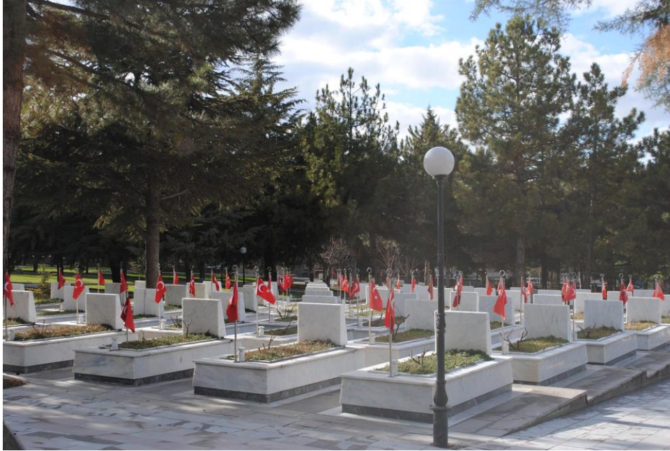
Fotoğraf 4: Mezar taşlarına yerleştirilen Türk bayrakları (Ocak 2013).

Mezar taşlarının anlattığı hikâyeyi daha yakından anlamak için mezarlıkların içlerine doğru girildiğinde, sivil mezarlıklarda karşılaşılmayan bir düzen dikkat çeker. Arazi içindeki parseller düzenli bir biçimde bölünmüş ve tüm mezarlıklar aynı hizada yer almaktadır. Askerî bir geçidi andırırçasına, her mezarlık nizami olarak bir sonrakini takip etmektedir. Ayrıca, her mezarlığın mezar taşı olmayan diğer ucuna bir Türk bayrağı yerleştirilmiştir (bkz. fotoğraf 4). Yönergede belirtilen kurallara paralel biçimde mezar taşlarının üzerinde aktarılan içerikler de, benzer bir düzen doğrultusunda sıralanmıştır: Askerî rütbelere, isimler, doğum ve ölüm yılları, memleketler vb. aynı sırayla aktarılmıştır. Bonatz (aktaran Mosse, 1979, s. 9-10) askeri mezarlıklardaki düzen ve uyumun sembolik düzlemde bireyin topluma tabiiyetini işaret ettiğini ve böylece mezarlıkları anıta dönüştürdüğünü belirtmektedir. Hatta, ona göre, askerî mezarlıklar, mezarlık oldukları kadar birer ulusal ibadethane olarak görülmesi nedeniyle, tıpkı ibadet mekanlarında olduğu gibi, her detayın belli bir biçimde tanımlandığı bir düzenlemeye sahiptir.