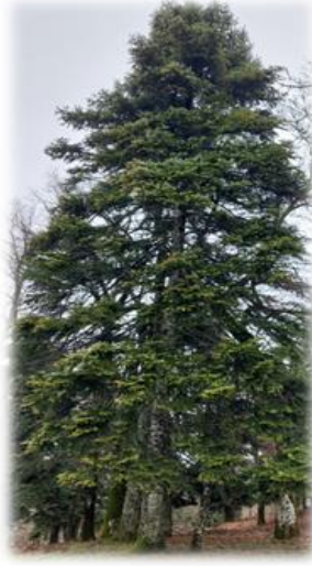
Görsel 3. Kaz Dağı Göknarı ( Abies equitrojani )

olarak geçmektedir. Jeolojik ve jeomorfolojik yakısı sayesinde kış yağışları sızarak yer altında su depoları (akifer) oluşturur ve bunlar yüzeye çıkarak bol debili kaynakları oluşturur. Kaz Dağı'ndan gelen orman havası ve denizin iyotlu, oksijen miktarı yüksek havası birleşince Altınoluk Şahin Deresi boğazı civarı oksijen çadırı şeklinde ifade edilmektedir. Dünyada oksijen miktarının yüksek olduğu ilk üç yerden birisi olarak tespit edilmiştir (Cürebal vd., 2012).