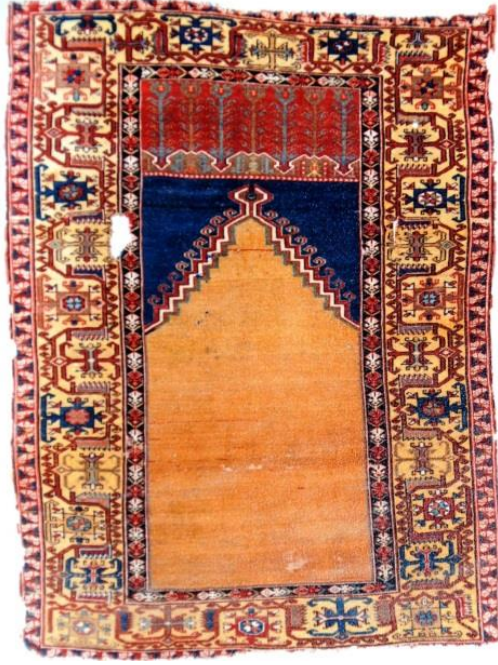
Örnek & Fotoğraf: 6

dikdörtgene yakın bir bölüm meydana gelmiştir. Burada hançer şekilli yapraklar ve stilize çiçek motiflerinden oluşan süsleme kompozisyonu yer alır. Mihrap nişinde görülen ibrik motiflerine burada da yer verilmiştir. Mihrap üçgeninde, basamakların başladığı noktada simetrik olarak birer ibrik motifi tasviri vardır.