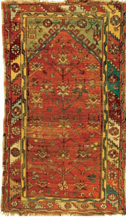
Örnek & Fotoğraf: 11 20. Yüzyıl Lâdik Seccade Halısı Konya Müzesi Halı Kataloğu I'den Envanter no: 5340

Kandil, Kur'an-ı Kerim'de "Allah göklerin ve yerin nurudur, O'nun nurunun temsili, içinde lamba bulunan bir kandillik gibidir" şeklinde geçmektedir (Kur'an-ı Kerim, Nur Suresi, 35. Ayet). İslam sanatında kandil tasviri, manevi bir değer taşımaktadır. Bu özellik, kandildeki ateşin, dolayısıyla "nur"a çevrilmesinden ileri gelmektedir (Aksel, 1966, s.47). Anılan ayet'te tefsir edilen kandil deseni halk arasında halı, kilim ve diğer el sanatları ile mimaride bir desen haline gelmiş, zamanla kandil nur yani ışık ve temizlik ile özleştirilmeye başlanmıştır. Sonuçta üzerinde namaz kılınan seccadelere mihraptan aşağı doğru sarkan bir kandil motifi dokumak gelenek halini almıştır (Deniz, 2000, s.198-199).