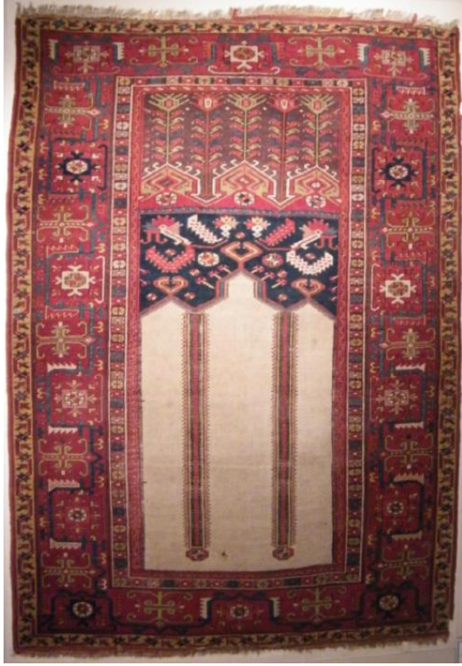
Örnek & Fotoğraf: 3 18. Yüzyıl Lâdik Seccade Halısı Konya Müzesi Halı Kataloğu I'den Envanter no: 820

Üç nişli mihraplı halıların bir başka formunu temsil eden 4. örnek, Türk El Halısı arşivinde 409 numaralı eserdir (Örnek & Fotoğraf: 4). 18. yüzyıla aittir. 115x172 cm. boyutlarında seccade halısıdır. Türk El Dokuması Halıları Projesi (TEH), Türk El Halısı arşivinde eserin Türk ve İslam Eserleri Müzesi'nde olduğu belirtilmiştir. Mihrap üçgeni üç bölümlüdür ve her biri birer âlem motifi nihayetlenir. Krem rengi mihrap zemininde, iki yanda yer alan sütunlar mihrap nişini üç bölüme ayırır. Bu sütunların her iki ucunda stilize birer çiçek motifi vardır. 3. örnekte mihrap zeminini bölen sütunlardan çok daha dekoratif tasvir edilmiştir. Mihrap nişindeki dekoratif sütunların yanı sıra mihrap üçgeninin üzerinde oluşan dikdörtgene yakın alanı hançer şekilli yapraklar ve aralarında yer alan stilize çiçek motifleri süsler.