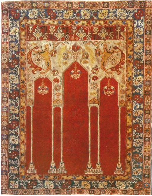
Örnek & Fotoğraf: 1

Üç nişli mihraplı 2. örnek, Türk El Halısı arşivinde 743 numaralı eserdir (Örnek & Fotoğraf: 2). 18. yüzyıla aittir. Seccade halısıdır 9 . Türk El Dokuması Halıları Projesi (TEH), Türk El Halısı arşivinde eserin Washington Tekstil Müzesi'nde olduğu belirtilmiştir. Bir önceki örnekte olduğu gibi mihrap üçgeni üç kemerlidir. Kemerleri taşıyan ince sütunlar mihrap zeminini üç bölüme ayırır. Böylece mihrap üç nişli bir görünüm kazanır. Orta niş yan nişlerden daha yüksek ve geniştir. Kırmızı renkli mihrap zemininde, kemerleri taşıyan sütunların dışında motif bulunmamaktadır. Mihrap nişine hareketlilik, mihrap kemerlerinin üzerini süsleyen hançer şekilli yapraklar ve stilize çiçek motifleri ile verilmiştir.