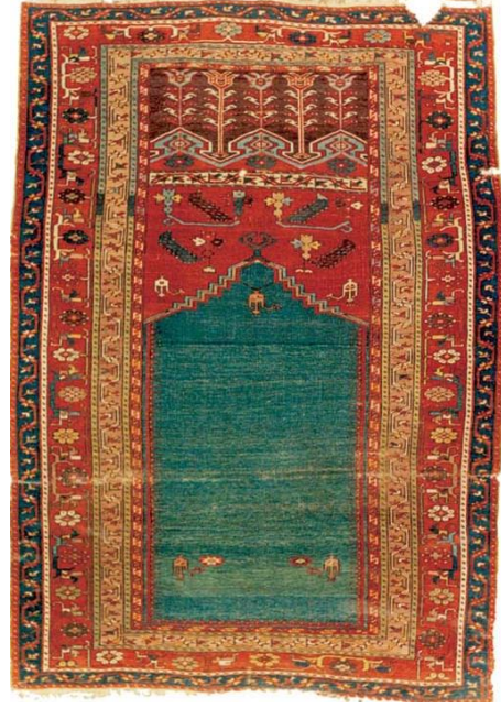
Örnek & Fotoğraf: 7

18. Yüzyıl Lâdik Seccade Halısı İstanbul Vakıf Eserleri Müzesi arşivinden Envanter no: 16-E19