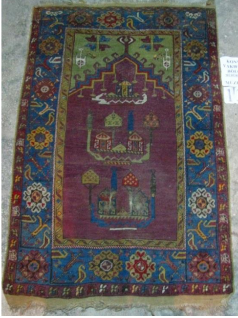
Örnek & Fotoğraf: 9 19. Yüzyıl Lâdik Seccade Halısı Konya Sahip Ata Vakıf Müzesi arşivinden Envanter no: 137

Manzara kuşağında yer alan motifler, bir önceki eserde olduğu gibi net değildir. Geometrik forma büründürülmüş ağaçlar arasında yer alan evler şekil olarak bozulmuş, geometrik birer öge şeklinde tasvir edilmiştir. Mihrap üçgeninin zemin çizgisine kadar uzanmaması nedeniyle mihrap köşeliklerine ek olarak mihrap üçgeni üzerinde bir süsleme alanı daha oluşmuştur. Köşelikleri simetrik birer ibrik motifi, mihrap üçgeni üzerini ise hançer şekilli yapraklar ve stilize çiçek motifleri süsler.