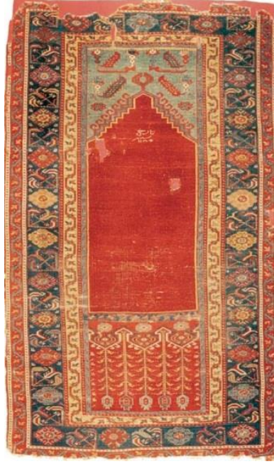
Örnek & Fotoğraf: 8