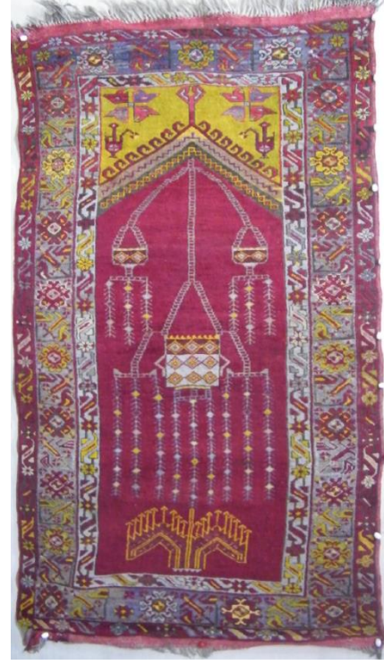
Örnek & Fotoğraf: 12 20. Yüzyıl Lâdik Seccade Halısı Konya Müzesi Halı Kataloğu I'den Envanter no: 5727