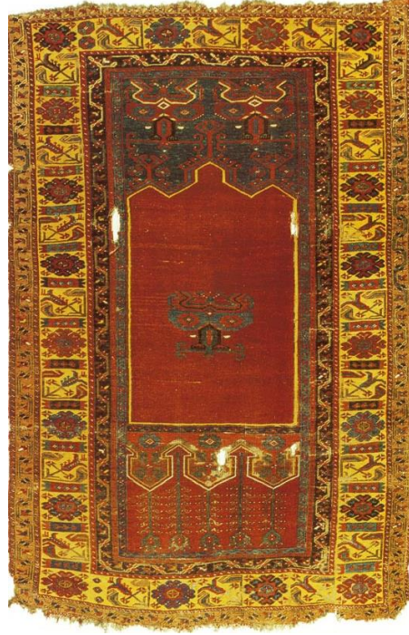
Örnek & Fotoğraf: 5 18. Yüzyıl Lâdik Seccade Halısı İstanbul Vakıf Eserleri Müzesi arşivinden Envanter no: 29-E54

Çalışmamızda yer verdiğimiz 6. örnek, tek nişli mihrap formundadır (Örnek & Fotoğraf: 6). İstanbul Vakıf Eserleri Müzesi'nde 16-E19 envanter numarası ile kayıtlıdır. 18. yüzyıla aittir. 110x160 cm. ölçülerinde seccade halısıdır. Mihrap üçgeni zemin çizgisine kadar basamak 10 şeklinde daralarak yükselir ve birleştiği noktada bir âlem motifi yer alır. Basamak şeklindeki mihrap üçgeni birkaç kontürle belirginleştirilmiştir. Basamaklar dıştan çengellidir. Mihrap nişi krem rengidir. Süsleme yoktur. Mihrap üçgeninin zemin çizgisine kadar yükselmesi sebebiyle iki yanda mihrap köşelikleri oluşmuştur. Mihrap köşeliklerinde zemin rengi koyu mavidir. Bu bölümde de süsleme yoktur.