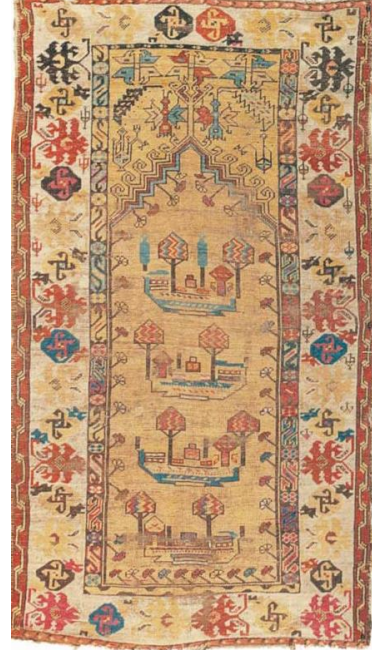
Örnek & Fotoğraf: 10 19. Yüzyıl Lâdik Seccade Halısı İstanbul TIEM arşivinden Envanter no: 1506

11. örnek, Konya Müzesi'nde 5340 envanter numarası ile kayıtlıdır (Örnek & Fotoğraf: 11). 20. yüzyıla aittir. 105x182 cm. ölçülerinde seccade halısıdır. Mihrap tek nişli tasvir edilmiştir. Mihrap üçgeni basamaklı değil, düz üçgen formdadır. İnce kontürlerle belirginleştirilen mihrap üçgeni dıştan çengellidir. Tepede âlem motifi yer alır. Mihrap köşeliklerinde simetrik birer ibrik ile stilize çiçek motifleri yer alır. Mihrap nişi kırmızı renklidir. Mihrap iç çeperini bir sıra çiçek motifleri çevrelemektedir. Hayat ağacı motifi, mihraptan aşağıya doğru uzanarak nişi doldurmaktadır.