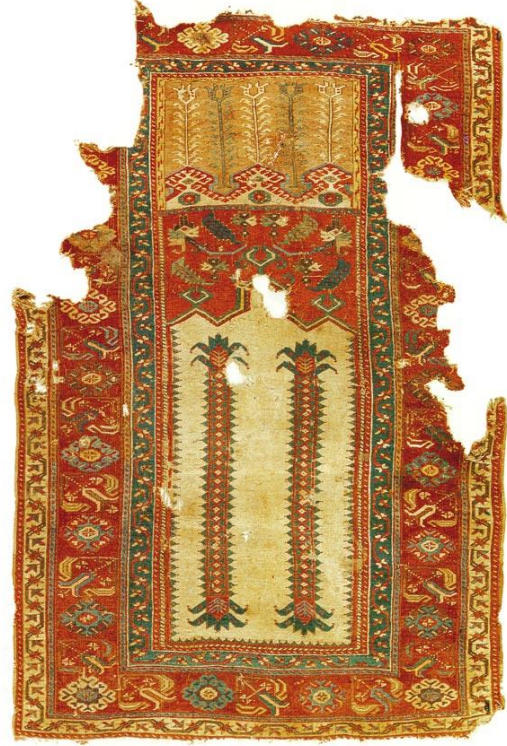
Örnek & Fotoğraf: 4 18. Yüzyıl Lâdik Seccade Halısı

Lâdik seccade halılarında tasvir edilen bir diğer mihrap formu tek nişli olanlardır. Çalışmamızda incelediğimiz örneklerden sekiz tanesi bu gruba girmektedir. Tek nişli örneklerde mihrap biçimi açısından en orijinal eser İstanbul Vakıf Eserleri Müzesi'nde, 29-E54 envanter numarası ile kayıtlıdır (Örnek & Fotoğraf: 5). 18. yüzyıla aittir. 115x170 cm. boyutlarında seccade halısıdır. Mihrap üçgeni üç bölümlüdür ve her biri birer âlem motifi ile nihayetlenir. Mihrap üçgeni bu şekilde tasvir edilen 3 ve 4 numaralı örneklerin mihrap nişinde yer alan sütunlar bu halıda yoktur. Kırmızı renkli mihrap nişi tek bölümlüdür ve ortada çiçek motiflerinden oluşmuş bir madalyon yer almaktadır. Dolayısıyla, üç bölümlü mihrap üçgenine sahip her halının üç nişli olmadığını göstermesi açısından önemli bir örnektir. Mihrap üçgeni üzerinde stilize çiçek motifleri ile oluşturulmuş süsleme kompozisyonu yer alır.