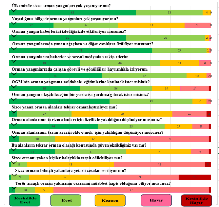
Şekil 2. Likert ölçeğine göre alınan cevaplar

Deneklere bir sonraki soruyu likert ölçeği şeklinde 1-5 arasında değer vererek cevaplamaları istenmiştir. Bu bölümde toplam 15 soru sorulmuş olup sonuçlar Şekil 2’de verilmiştir.